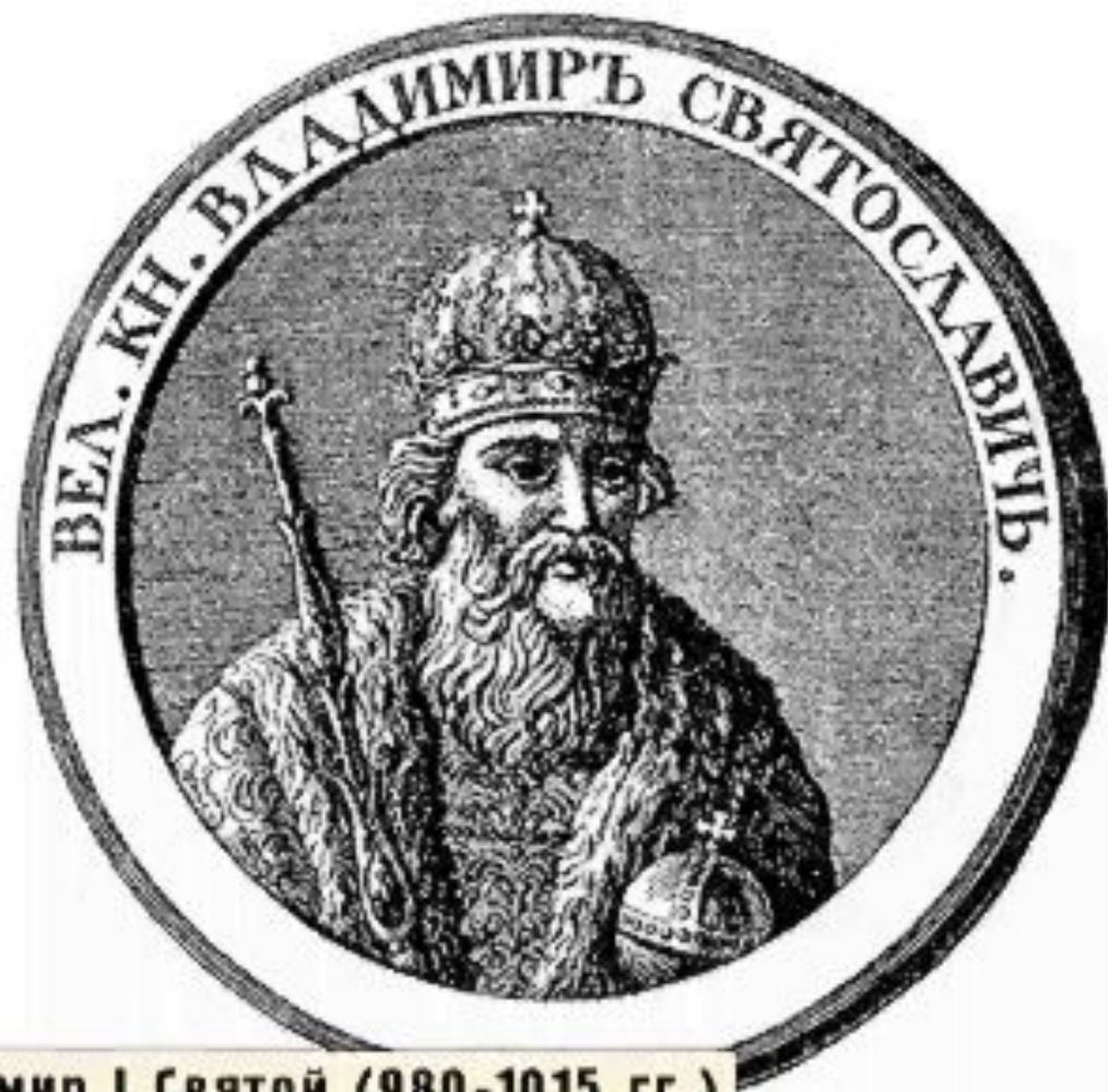
Владимир I Святой (980-1015 гг.)