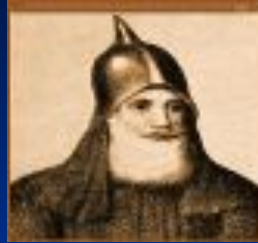
Рюрик (Новгород) 862-879