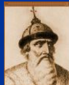
Владимир Мономах (1113-1125)