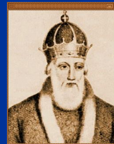
Владимир Красное Солнышко (Святой) (980-1054)