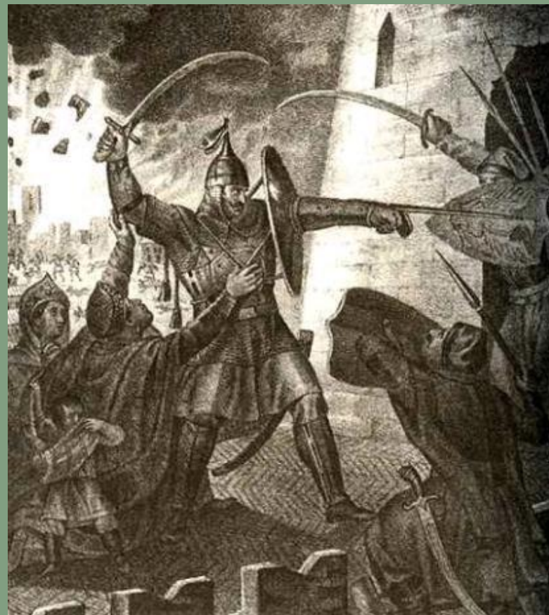
Михаил Борисович Шеин