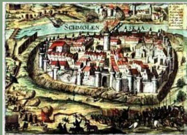
Осада Смоленска польской армией. 1609-1611 г. Гравюра начала XVII в.