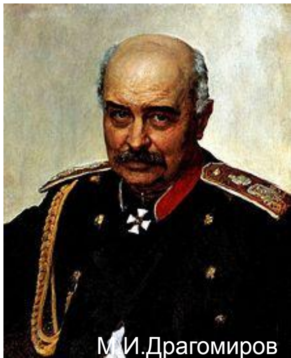
М. И. Драгомиров

Дух патриотизма, как беззаветной любви к Родине, своему Отечеству, лежит в основе и венчает всякую современную военную систему.