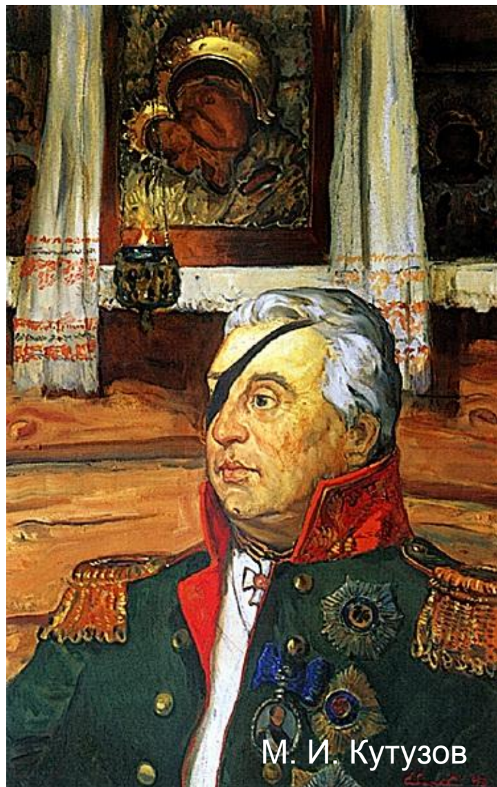
М. И. Кутузов