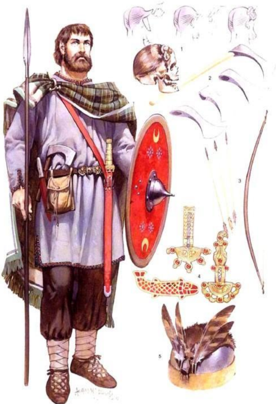
Frankish warrior, 6th century AD (See text commentary for detailed captions)