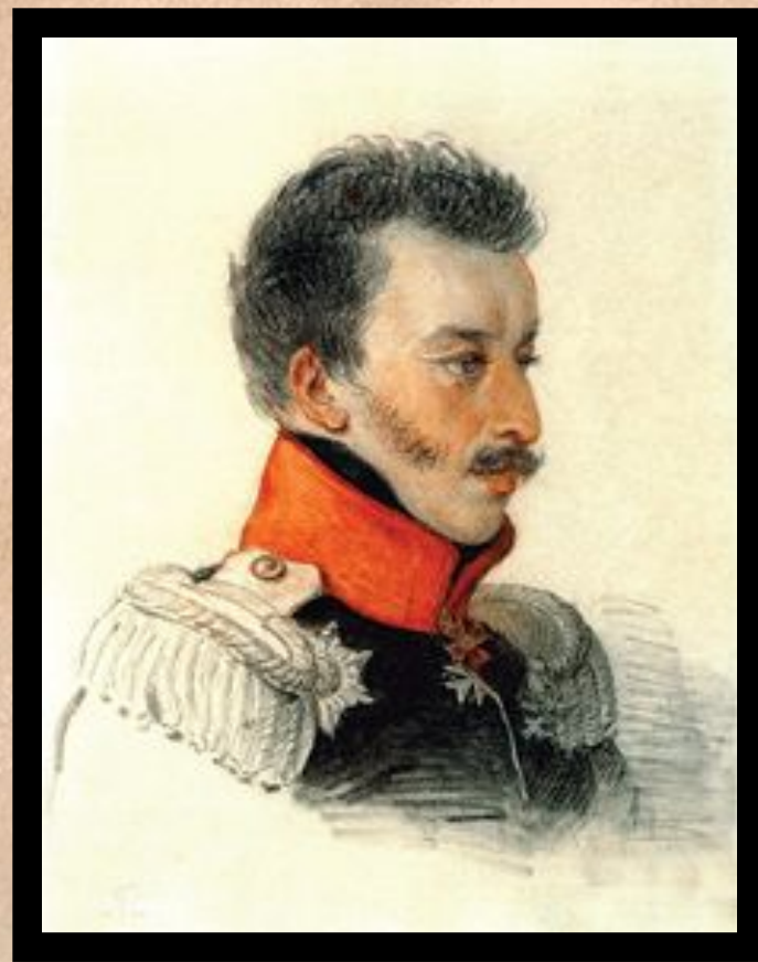
Сергей Григорьевич Волконский (8 декабря 1788 - 28 ноября 1865) — герой Отечественной войны 1812 года, декабрист