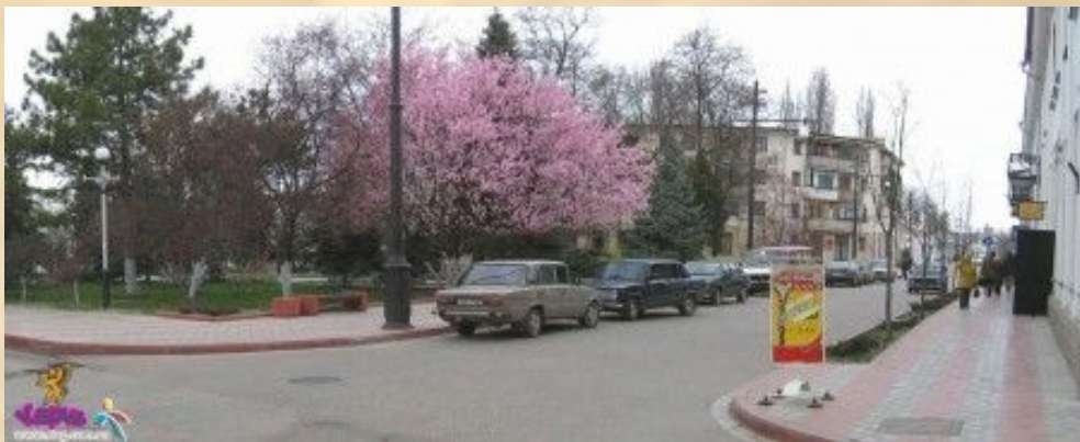
Улица им. Володи Дубинина.