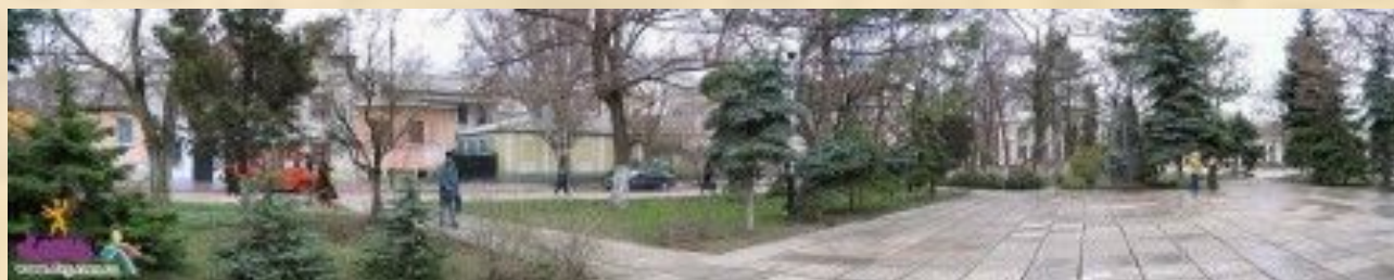
Пионерский сквер. Памятник Володе Дубинину.