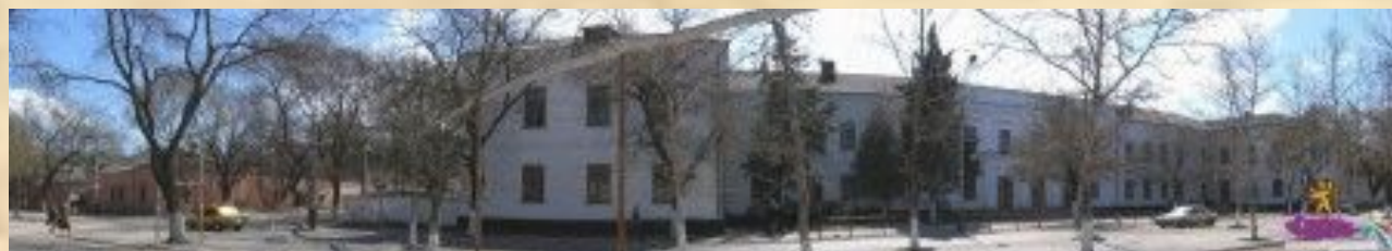
Здание средней школы им. Володи Дубинина (ул.Пирогова, 8 "а").