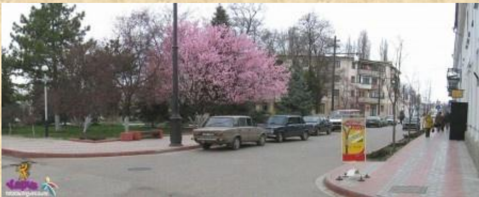
Улица им. Володи Дубинина.