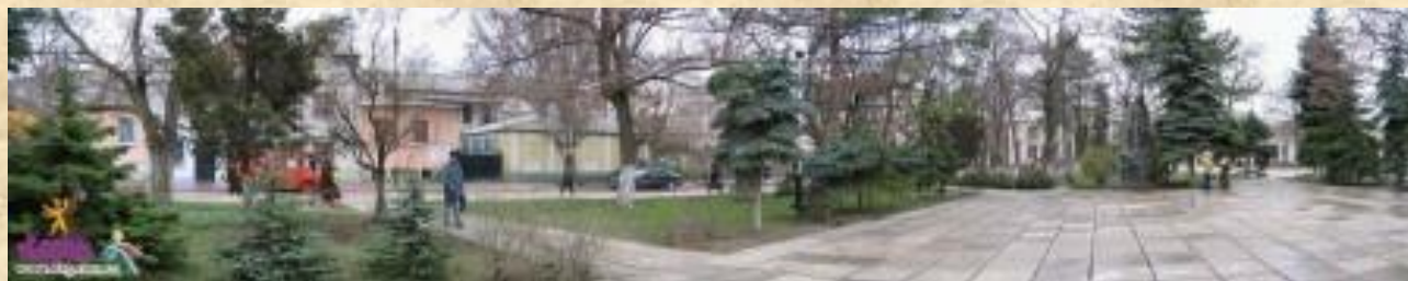
Пионерский сквер. Памятник Володе Дубинину.