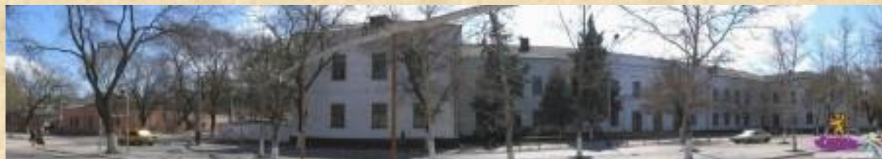
Здание средней школы им. Володи Дубинина (ул.Пирогова, 8 "а").