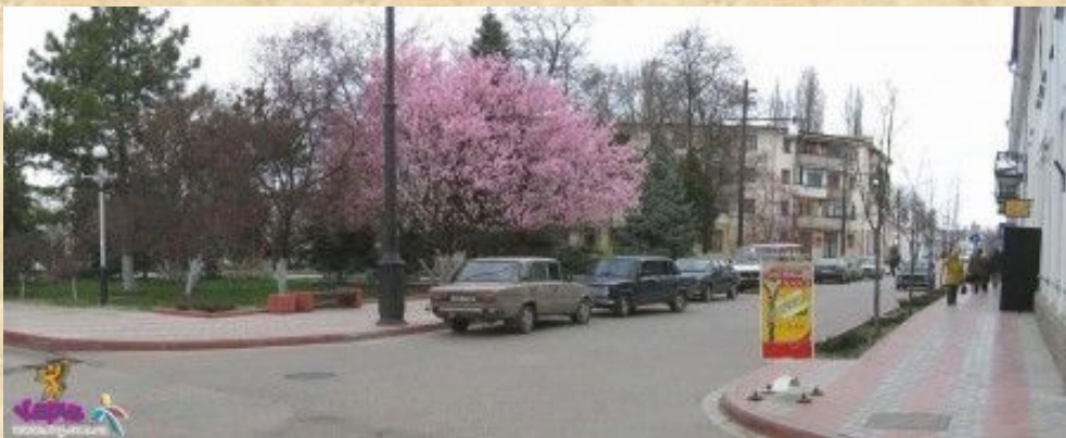
Улица им. Володи Дубинина.