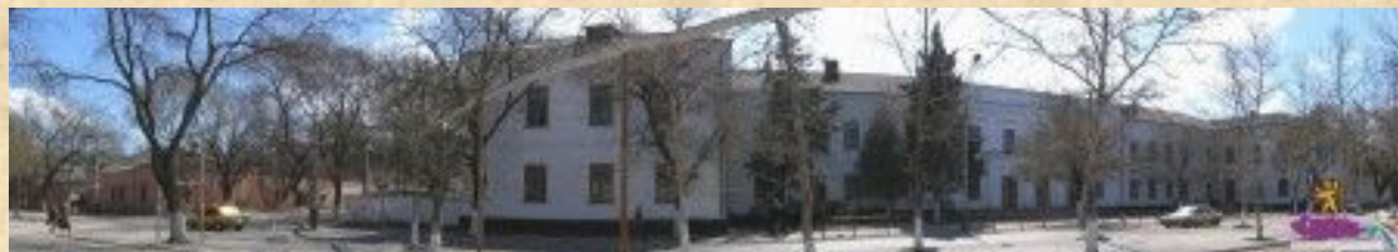
Здание средней школы им. Володи Дубинина (ул.Пирогова, 8 "а").