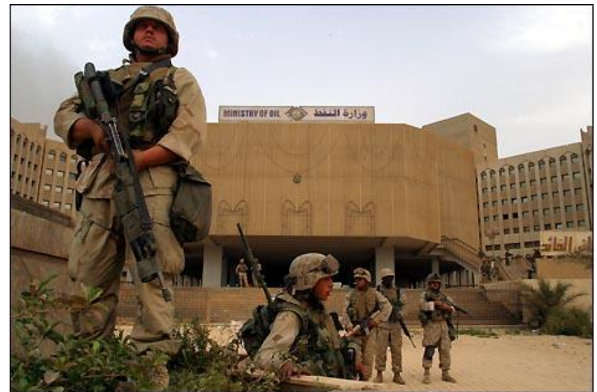
Солдаты США в центре Багдада

К 10 апреля общие американские потери составляли 108 убитых. Собственно во время штурма Багдада было потеряно несколько десятков убитыми и ранеными, сбит штурмовик А-10 (пилот спасся). Подбиты несколько танков и БМП. Во время штурма и предшествующей авиационной подготовки Багдад пострадал несильно, поскольку использовалось почти исключительно высокоточное оружие. Население Багдада во время авиаударов не пряталось в убежища, поскольку на опыте убедилось, что американцы воздерживаются от огульных огневых ударов по площадям.