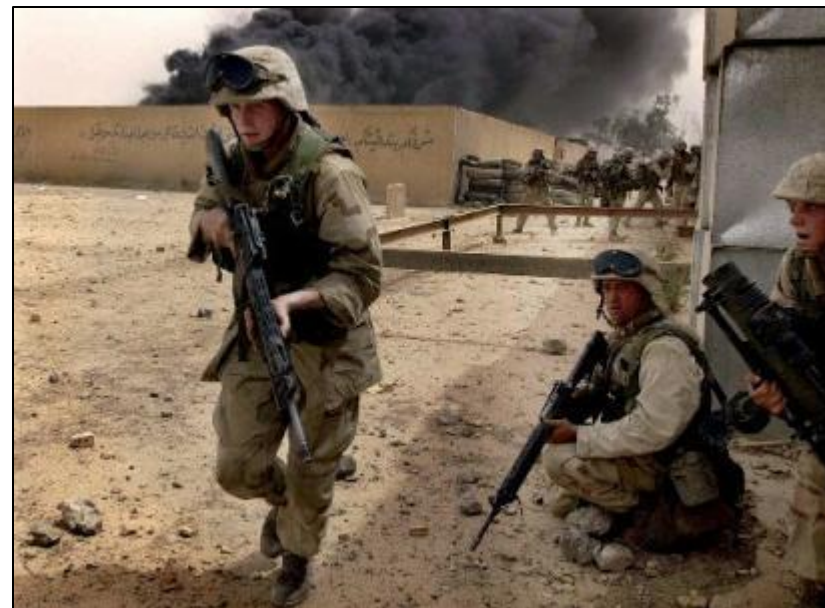
Бои в Басре