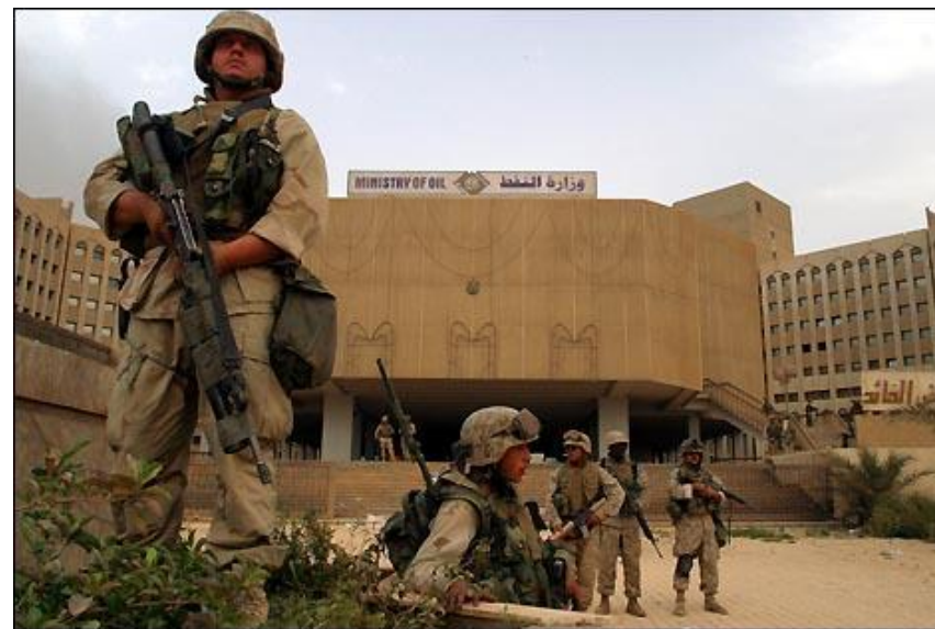
Солдаты США в центре Багдада

К 10 апреля общие американские потери составляли 108 убитых. Собственно во время штурма Багдада было потеряно несколько десятков убитыми и ранеными, сбит штурмовик А-10 (пилот спасся). Подбиты несколько танков и БМП. Во время штурма и предшествующей авиационной подготовки Багдад пострадал несильно, поскольку использовалось почти исключительно высокоточное оружие. Население Багдада во время авиаударов не пряталось в убежища, поскольку на опыте убедилось, что американцы воздерживаются от огульных огневых ударов по площадям.