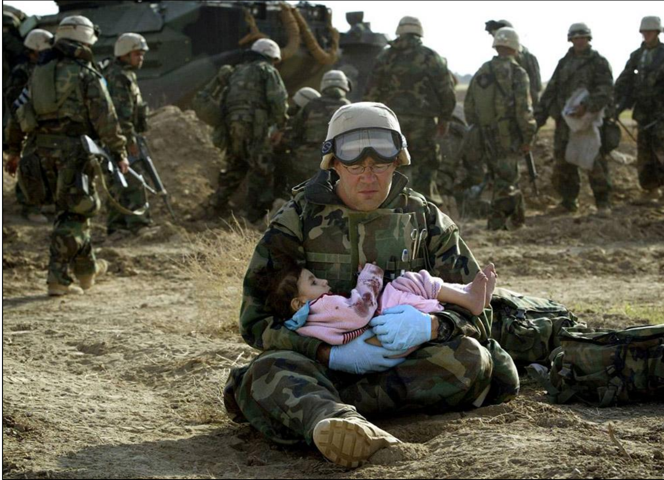
Врач морской пехоты держит на руках иракскую девочку в центральном Ираке 29 марта 2003 года. Когда местные солдаты начали вытеснять гражданских жителей в сторону позиций морских пехотинцев, перекрестный огонь на линии фронта разбил иракскую семью.