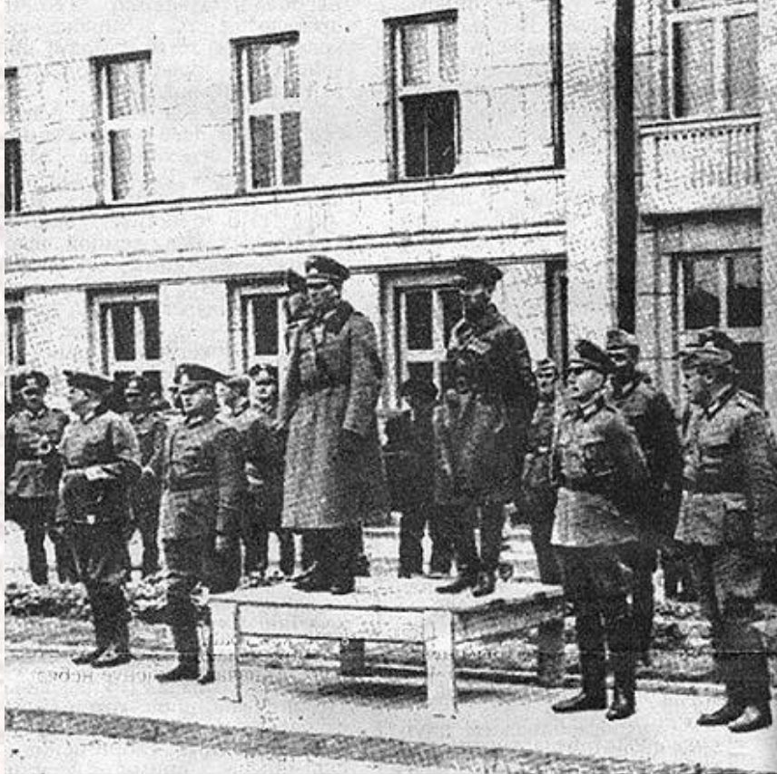
Сумесны ваенны парад часцей верхмата і Чыр Брэст 22-е верасня 1939 года.