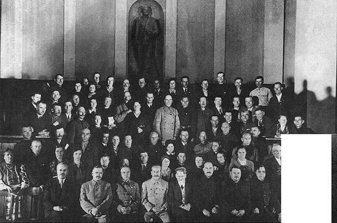
Члены паўнамоцнай камісіі Народнага сходу Заходняй Беларусі на пры 2 лістапада 1939 г.