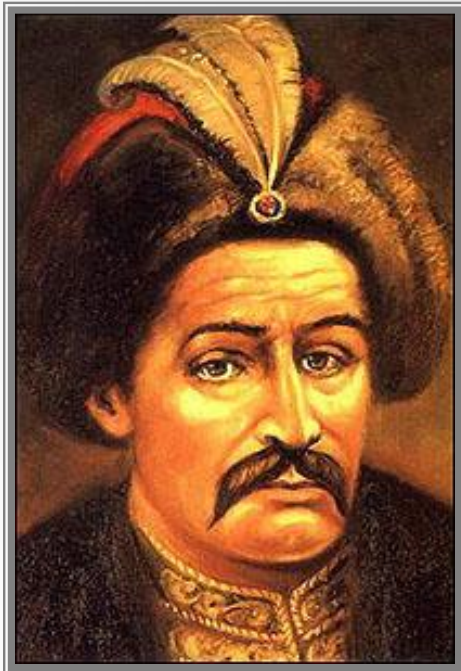
Мазепа Иван Степанович

Булавин строил план широкой «казачьей коалиции» вместе с украинским гетманом Мазепой и совместных действий против имперского правительства. Повстанцы создали свою воен. организацию и выработали свои методы ведения боя, в основу которых лёг опыт казачьего войска). Ядро булавинцев составляли казаки, беглые солдаты и драгуны; крестьяне обучались простейшим навыкам военного дела в ходе борьбы. Повстанцы действовали в конном и пешем строю, сражались в полевых условиях, вели оборону и осаду крепостей. Внезапность и решительность нападения в сочетании с широкой поддержкой населения нередко приносили им успех. В полевом бою повстанцы применяли повозки для прикрытия войск, усиливали свои позиции возведением простейших укреплений, установкой в них захваченных орудий.