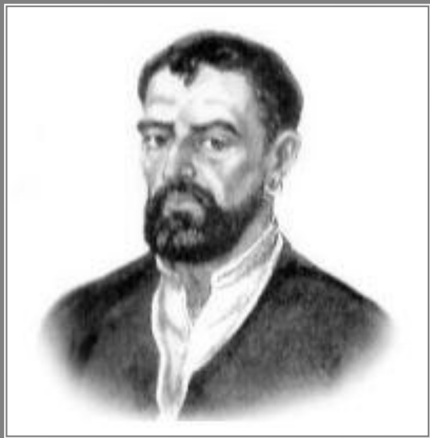
Булавин Кондратий Афанасьевич