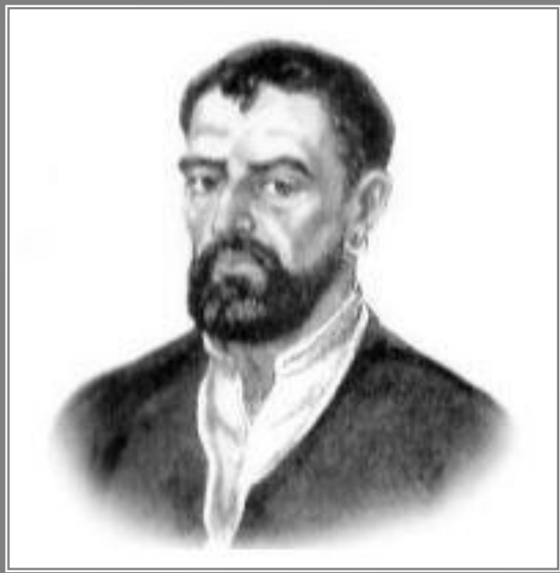
Булавин Кондратий Афанасьевич