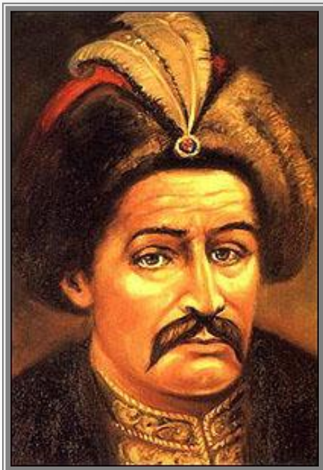
Мазепа Иван Степанович

Булавин строил план широкой «казачьей коалиции» вместе с украинским гетманом Мазепой и совместных действий против имперского правительства. Повстанцы создали свою воен. организацию и выработали свои методы ведения боя, в основу которых лёг опыт казачьего войска). Ядро булавинцев составляли казаки, беглые солдаты и драгуны; крестьяне обучались простейшим навыкам военного дела в ходе борьбы. Повстанцы действовали в конном и пешем строю, сражались в полевых условиях, вели оборону и осаду крепостей. Внезапность и решительность нападения в сочетании с широкой поддержкой населения нередко приносили им успех. В полевом бою повстанцы применяли повозки для прикрытия войск, усиливали свои позиции возведением простейших укреплений, установкой в них захваченных орудий.