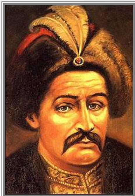
Мазепа Иван Степанович

Булавин строил план широкой «казачьей коалиции» вместе с украинским гетманом Мазепой и совместных действий против имперского правительства. Повстанцы создали свою воен. организацию и выработали свои методы ведения боя, в основу которых лёг опыт казачьего войска). Ядро булавинцев составляли казаки, беглые солдаты и драгуны; крестьяне обучались простейшим навыкам военного дела в ходе борьбы. Повстанцы действовали в конном и пешем строю, сражались в полевых условиях, вели оборону и осаду крепостей. Внезапность и решительность нападения в сочетании с широкой поддержкой населения нередко приносили им успех. В полевом бою повстанцы применяли повозки для прикрытия войск, усиливали свои позиции возведением простейших укреплений, установкой в них захваченных орудий.