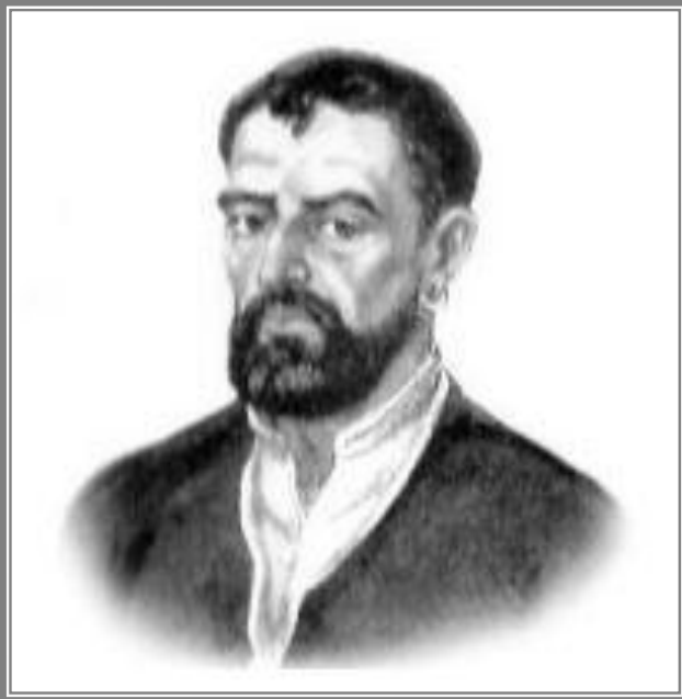
Булавин Кондратий Афанасьевич