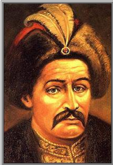
Мазепа Иван Степанович

Булавин строил план широкой «казачьей коалиции» вместе с украинским гетманом Мазепой и совместных действий против имперского правительства. Повстанцы создали свою воен. организацию и выработали свои методы ведения боя, в основу которых лёг опыт казачьего войска). Ядро булавинцев составляли казаки, беглые солдаты и драгуны; крестьяне обучались простейшим навыкам военного дела в ходе борьбы. Повстанцы действовали в конном и пешем строю, сражались в полевых условиях, вели оборону и осаду крепостей. Внезапность и решительность нападения в сочетании с широкой поддержкой населения нередко приносили им успех. В полевом бою повстанцы применяли повозки для прикрытия войск, усиливали свои позиции возведением простейших укреплений, установкой в них захваченных орудий.