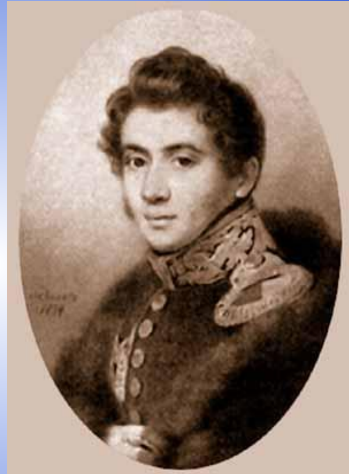
Н. Муравьев, автор Конституции – программы Северного общества