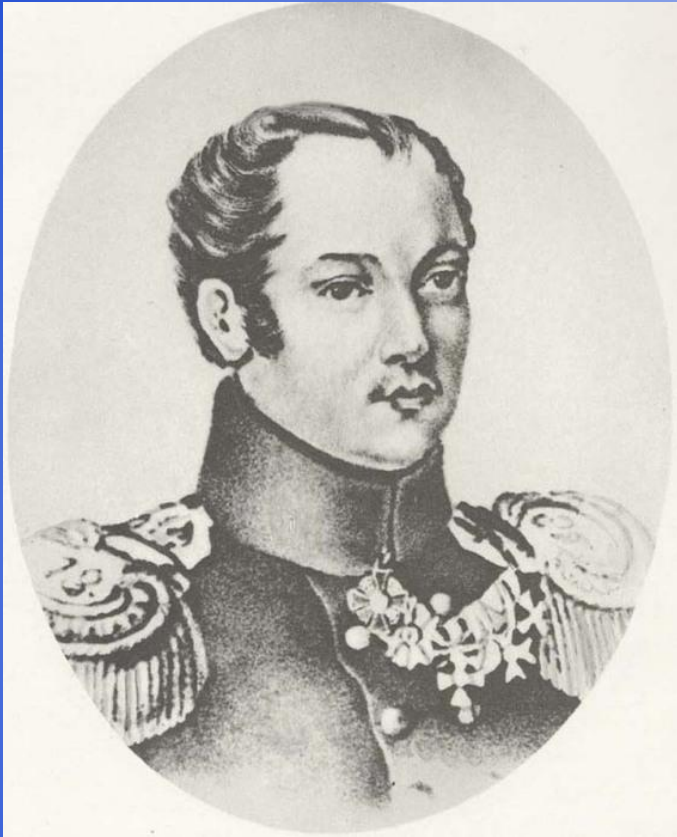
П. Пестель, автор «Русской правды»