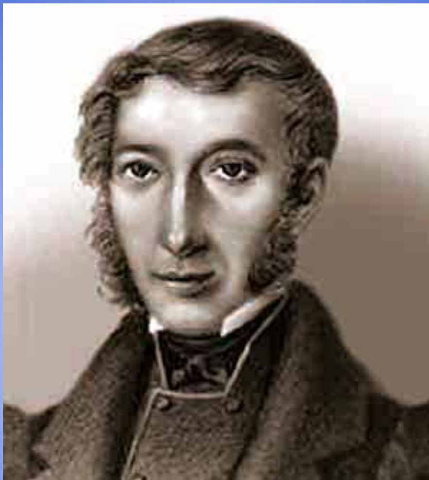
С. Трубецкой, диктатор восстания