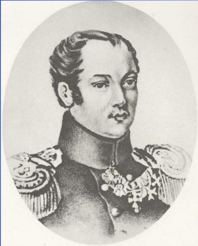
П. Пестель, автор «Русской правды»