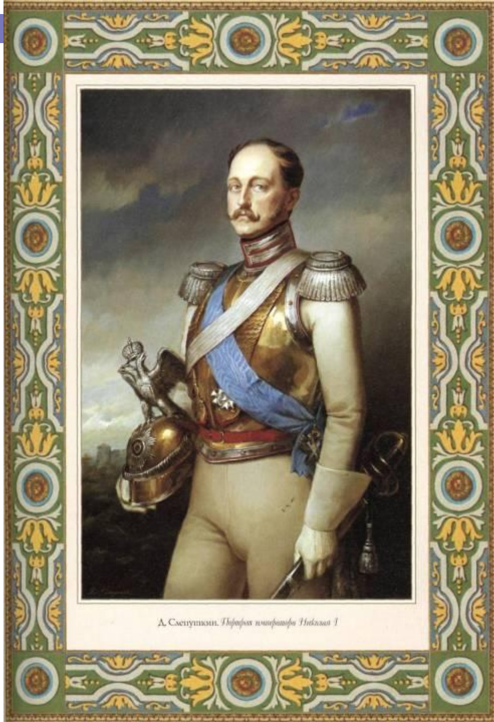
А. Свешников. Портрет императора Николая I