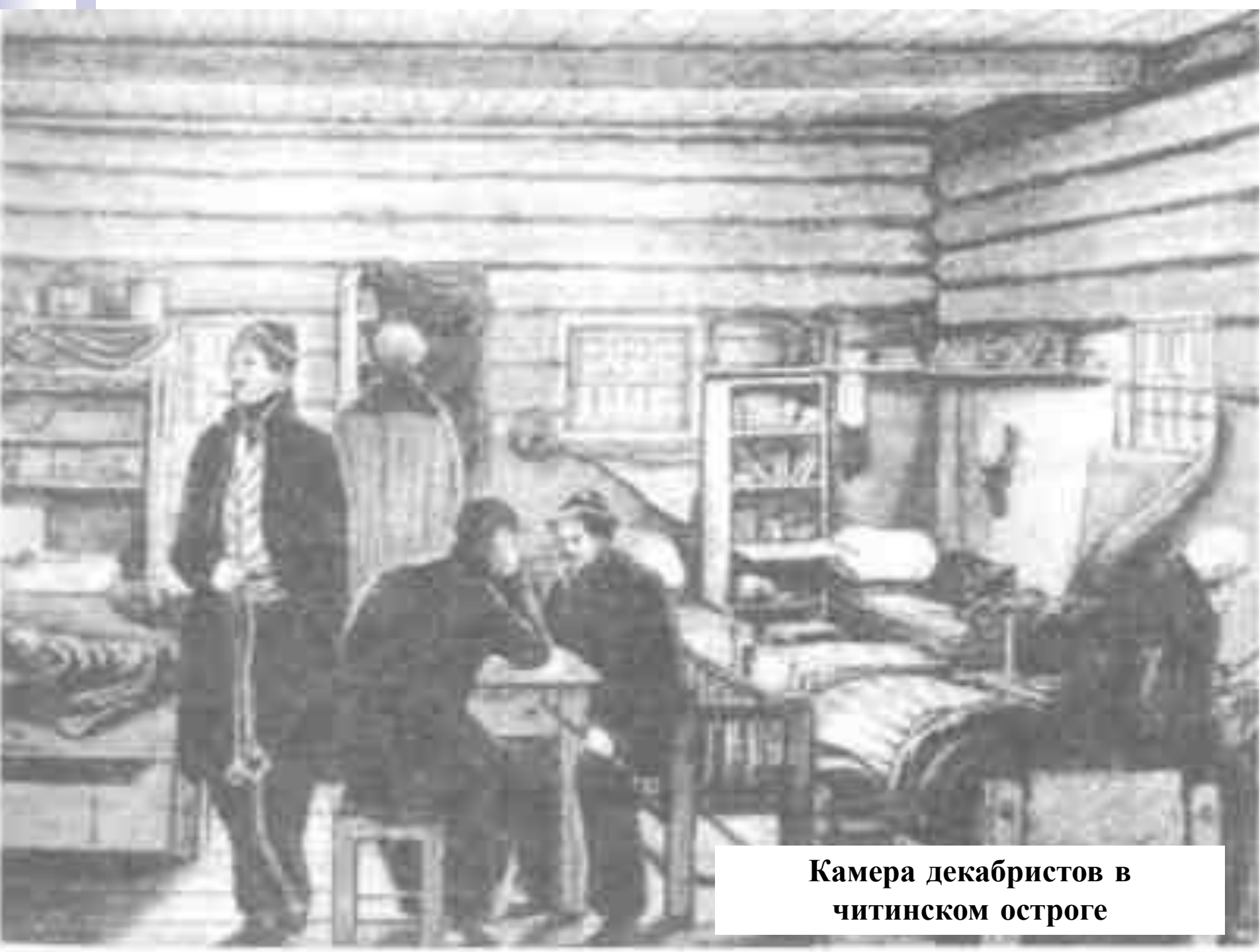
Камера декабристов в читинском остроге