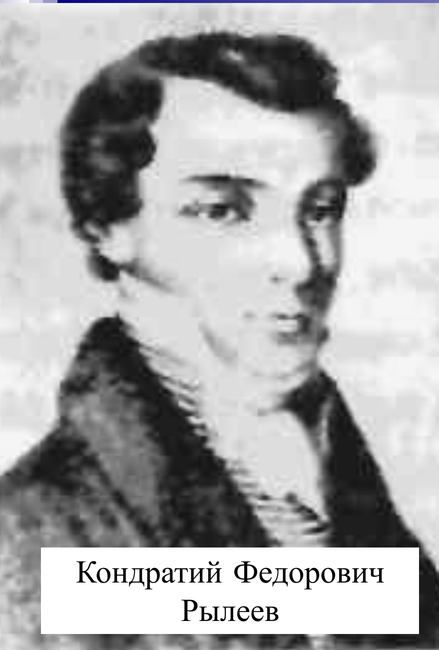
Кондратий Федорович Рылов