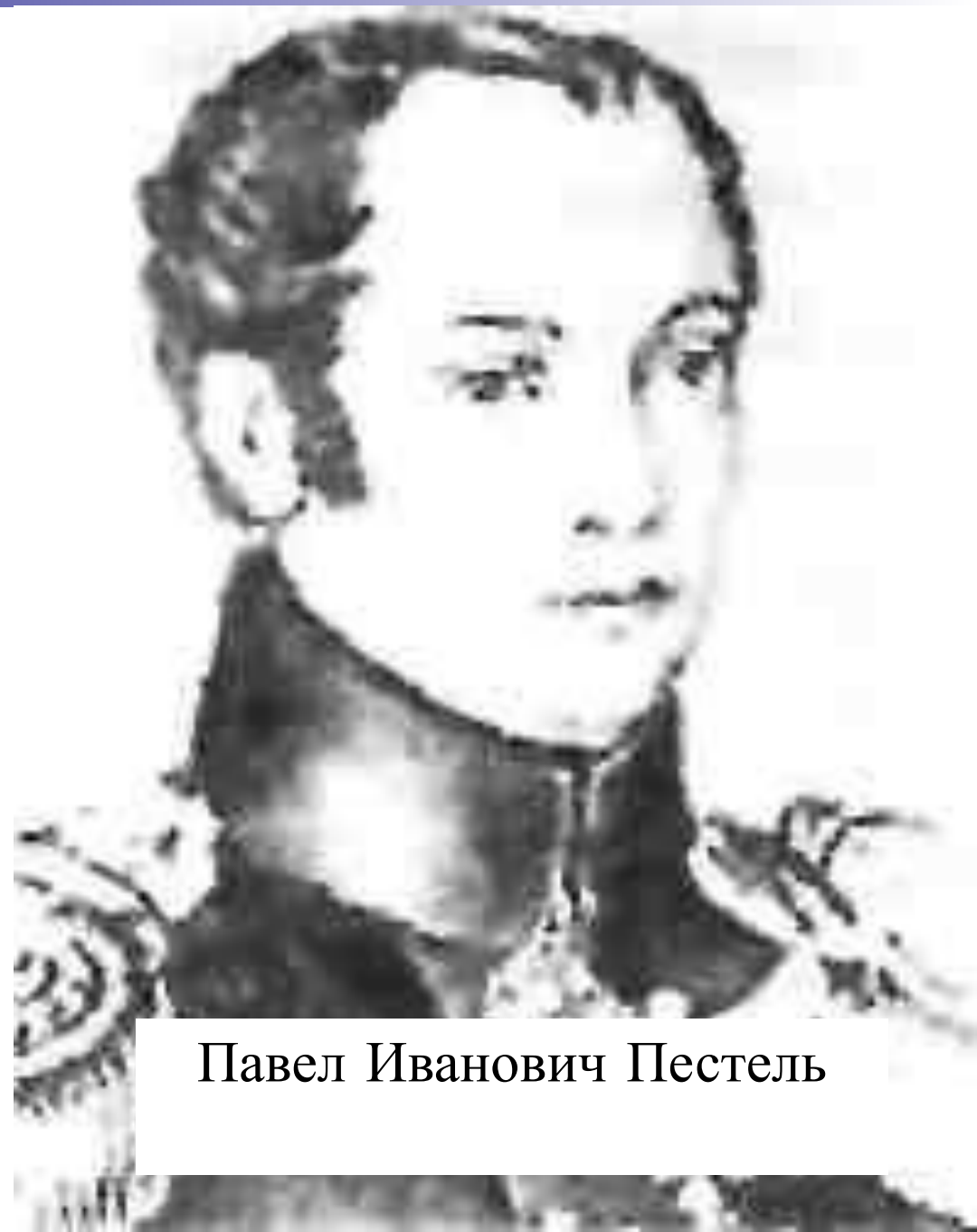
Павел Иванович Пестель