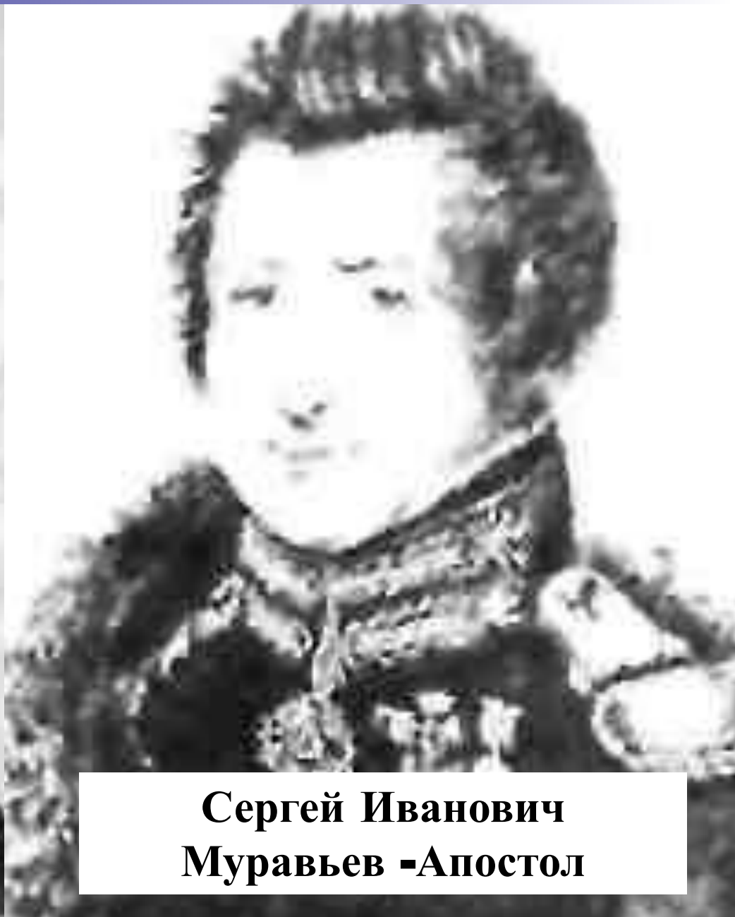
Сергей Иванович Муравьев -Апостол