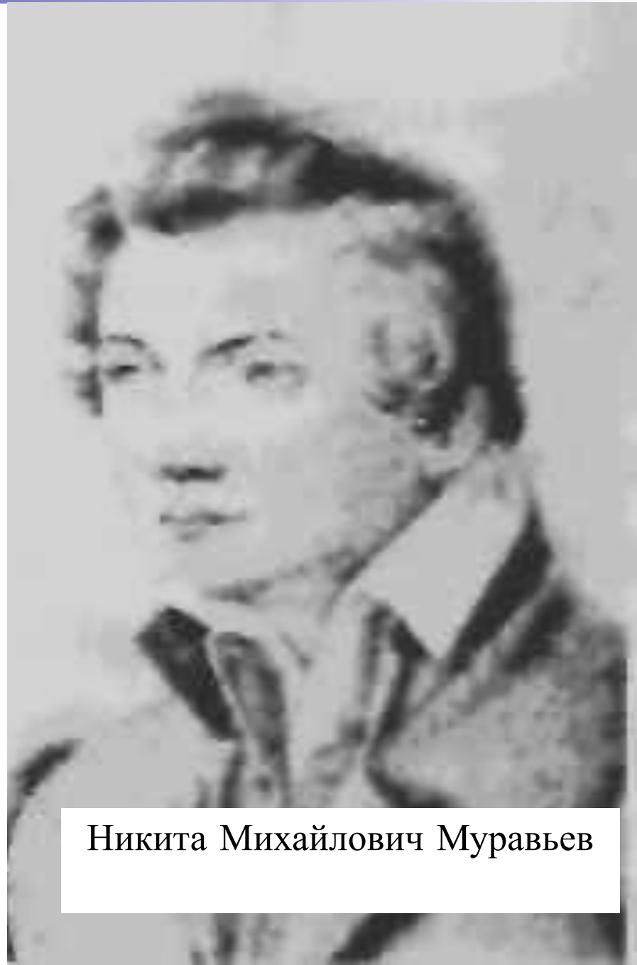
Никита Михайлович Муравьев