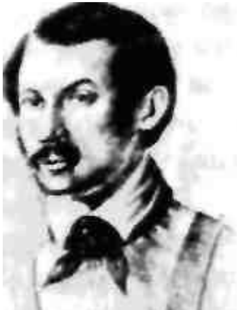
Александр Александрович Бестужев