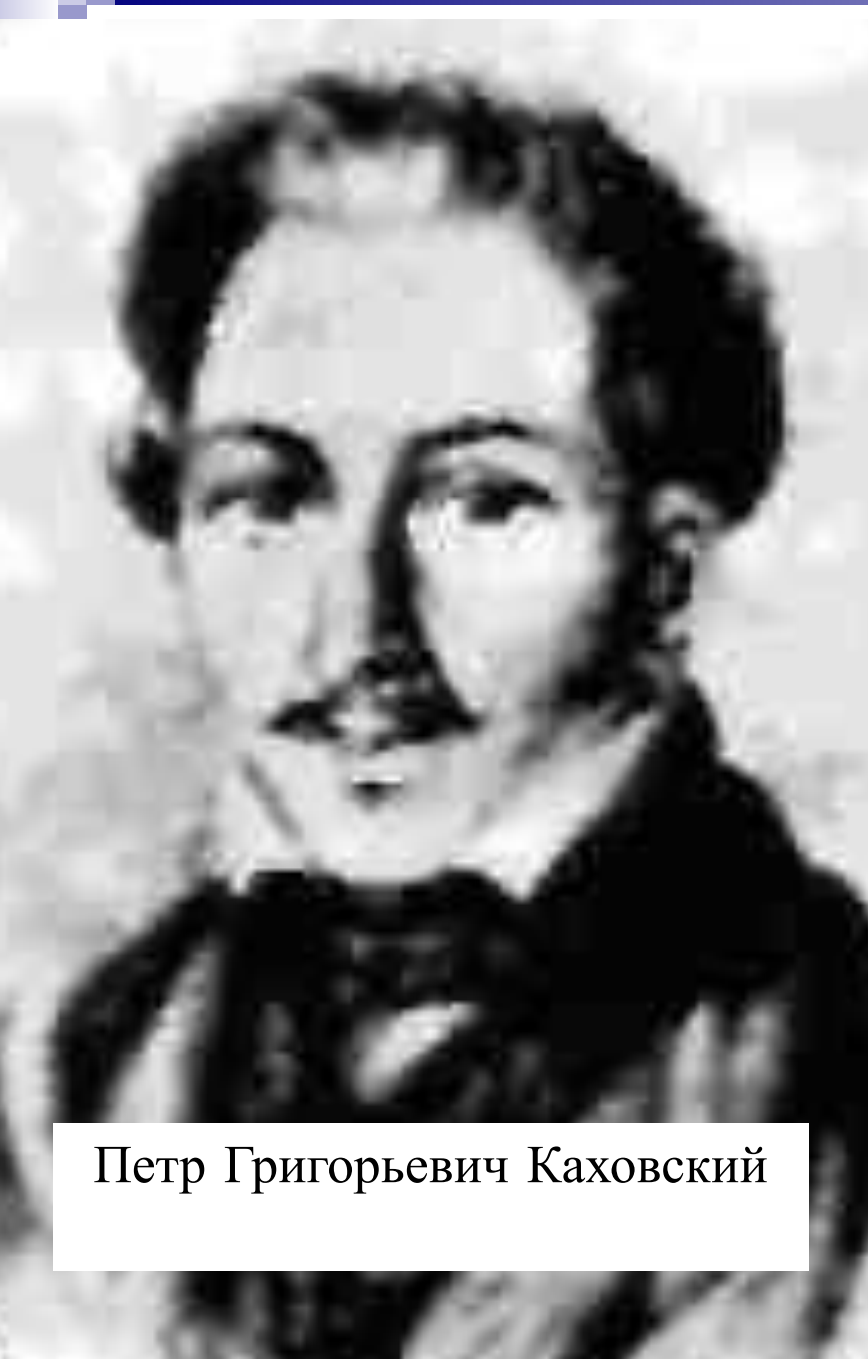
Петр Григорьевич Каховский