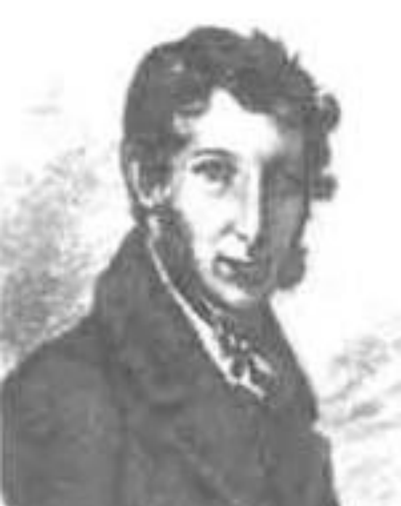
Князь Сергей Петрович Трубецкой