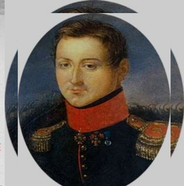
С.Муравьев - Апостол

Пять декабристов: П. И. Пестель, С. И. Муравьев-Апостол, М.П. Бестужев-Рюмин, К. Ф. Рылев, П. Г. Каховский приговорены к смертной казни четвертованием, замененной повешением.