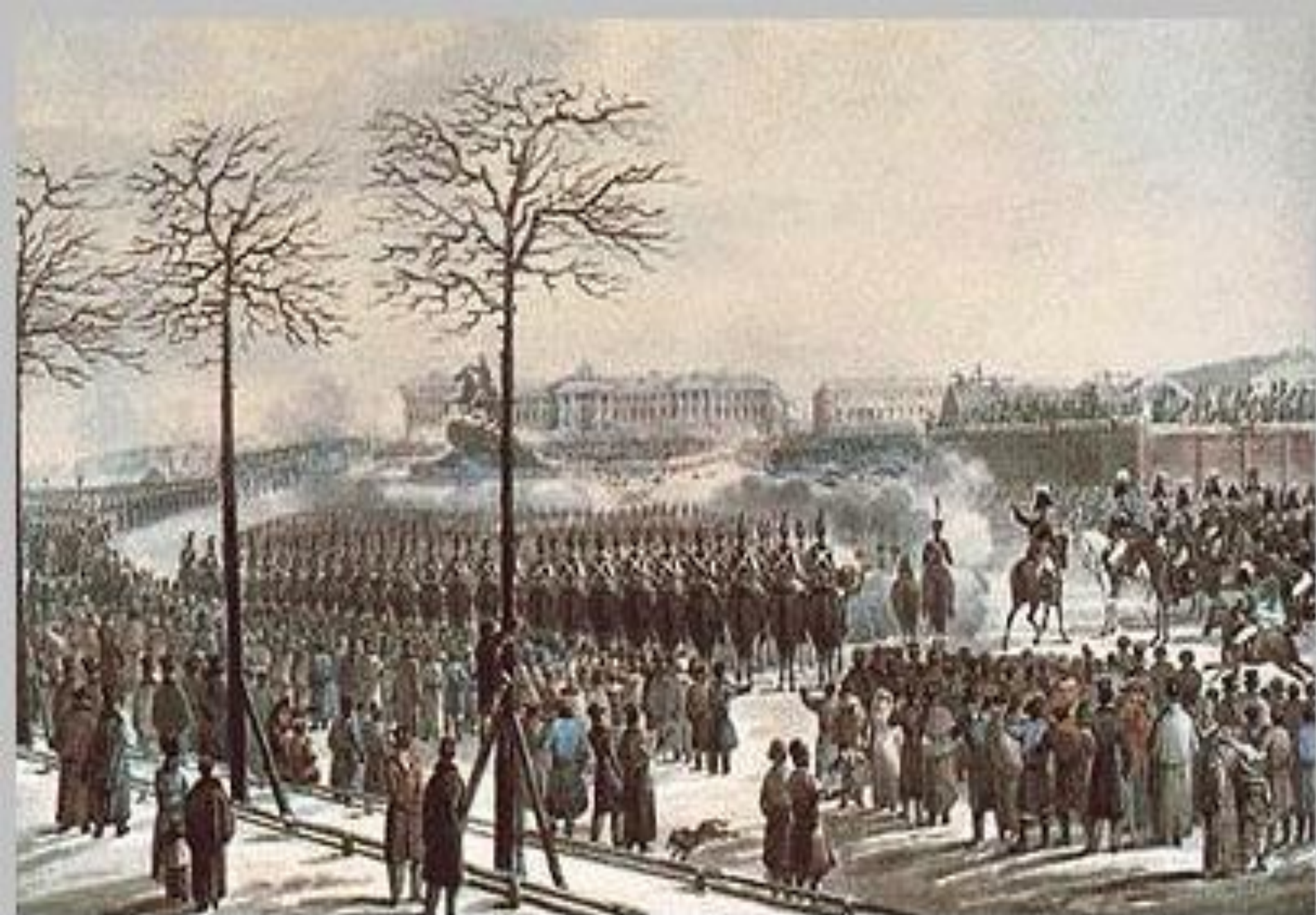
Восстание на Сенатской площади. Акварель Кольмана