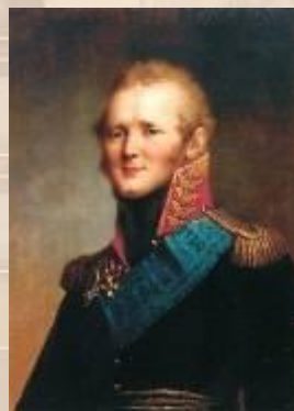
Александр I (1801 – 1825)

1797 г. – указ Павла I о престолонаследии