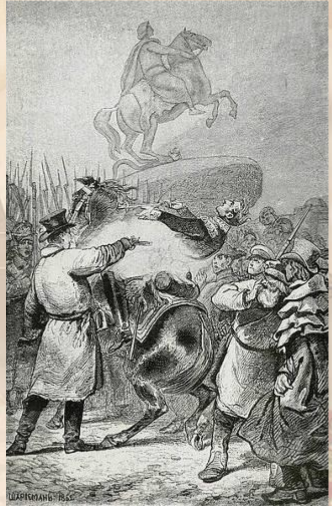
Нанесение смертельной раны М. А. Милорадовичу