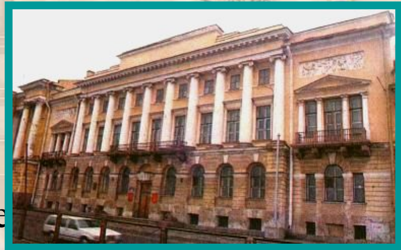
Дом в котором прошло последнее собрание декабристов