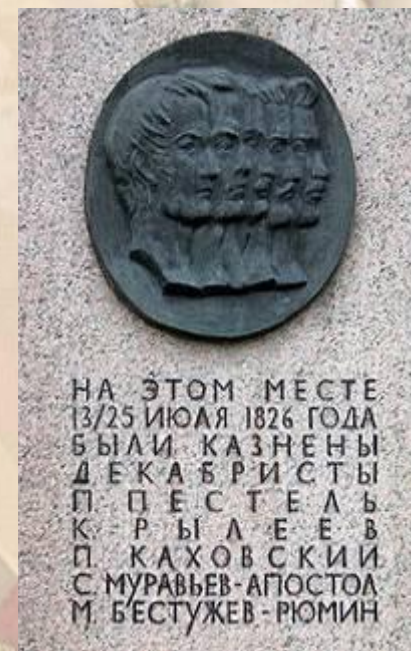
Монумент на месте казни декабристов