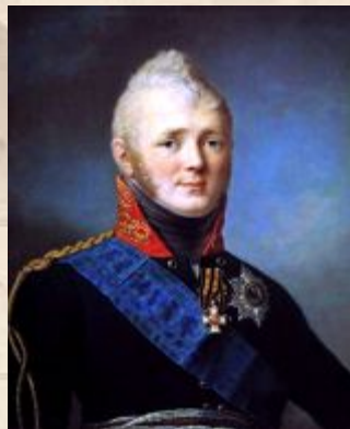
Константин – 1822 отказ от престола