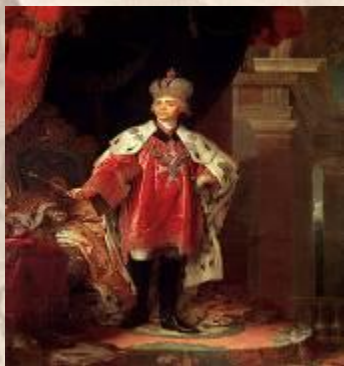
Павел I (1796 - 1801)

19 ноября 1825 г. – неожиданно умирает Александр I.