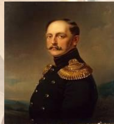
Николай I (1825 - 1855)