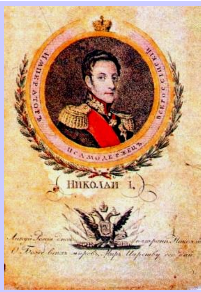
Листовка выпущенная К коронации Николая I.

Рано утром 14 декабря декабристы отправились по своим полкам, но лишь Н.Бестужеву и Дм. Ростовскому-Шеппину удалось вывести на Сенатскую площадь Московский полк.