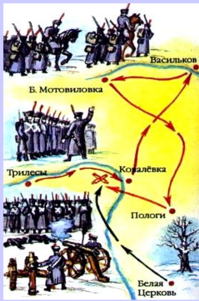
Восстание Черниговского полка.

Южное общество должно было выступить, получив известие о победе в столице.