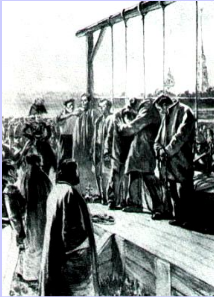
Д.Кардовский Казнь декабристов

Суд Определил декабристов по «разрядам». 5-о оказались вне их-Пестель, Рылеев, Каховский, Муравьев-Апостол, Бес тужев-Рюмин-они были повешены.