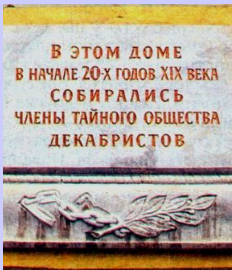
Мемориальная доска В Москве.

Восстание положило начало освободительному движению против самодержавия в России.