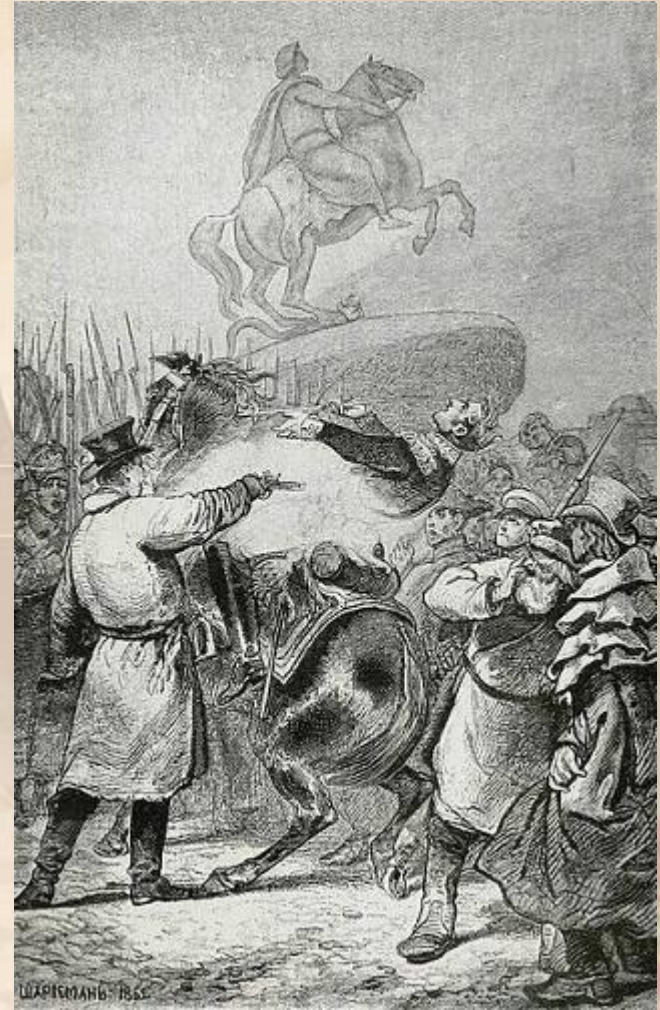
Нанесение смертельной раны М. А. Милорадовичу