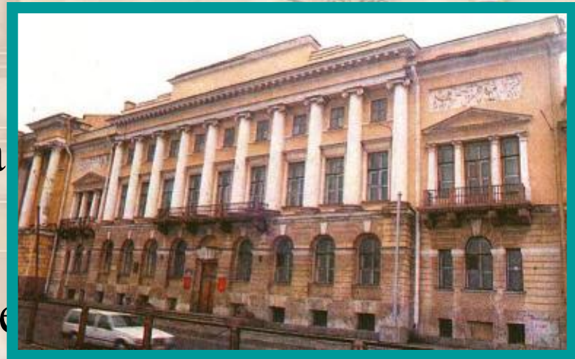
Дом в котором прошло последнее собрание декабристов