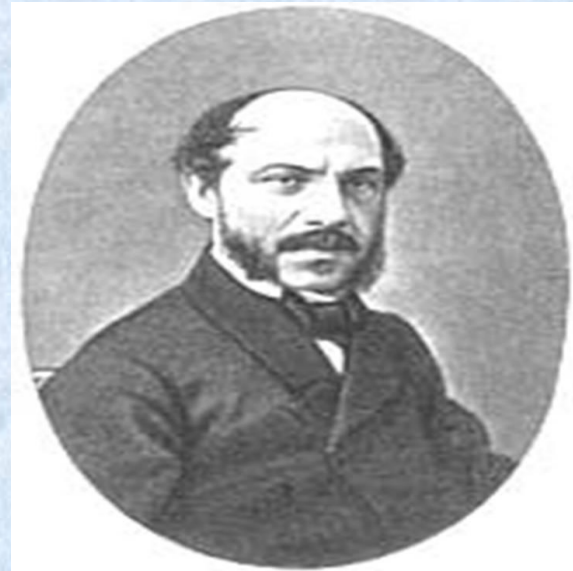
В. П. Боткин