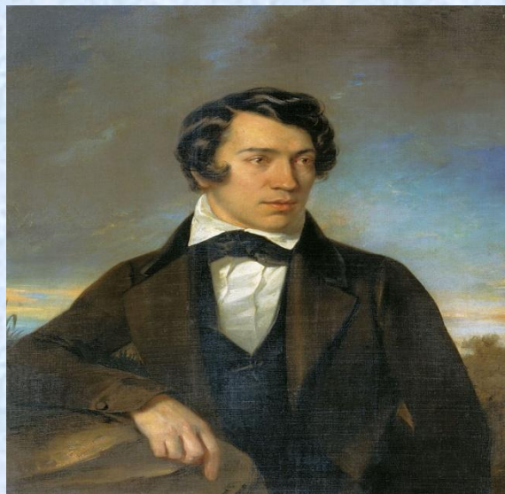
А. С. Хомяков