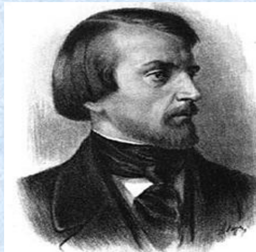
В. Г. Белинский