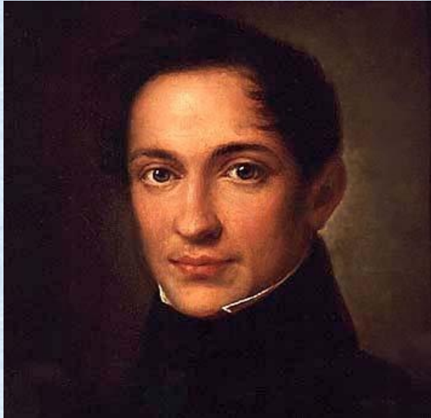
А. И. Герцен