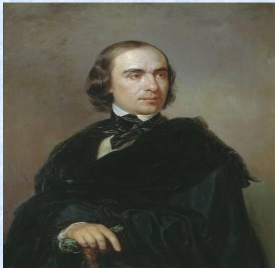
П. Я. Чаадаев