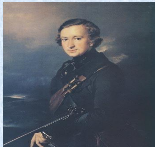
Ю. Ф. Самарин