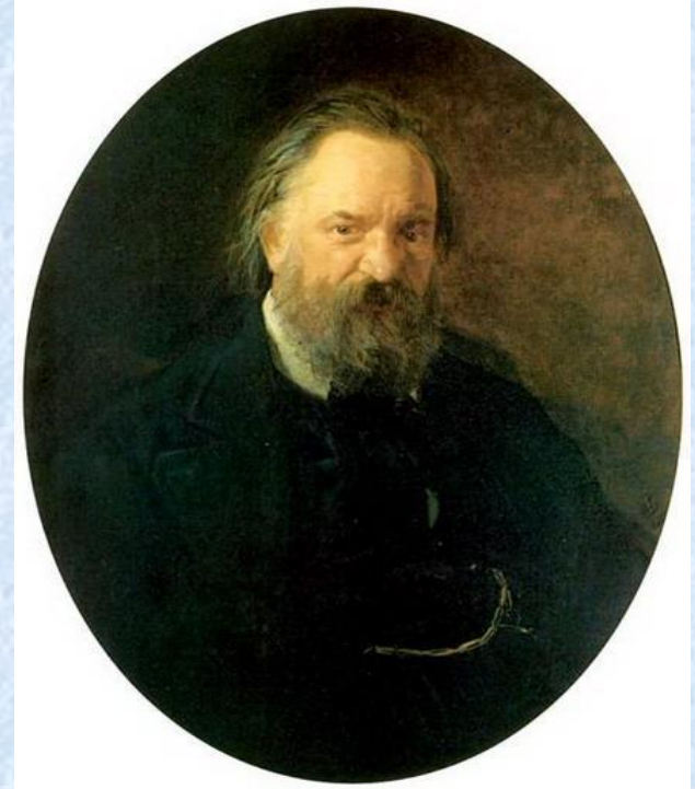
М. В. Буташевич-Петрашевский