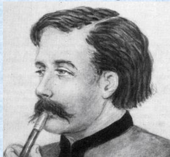
И. В. Киреевский