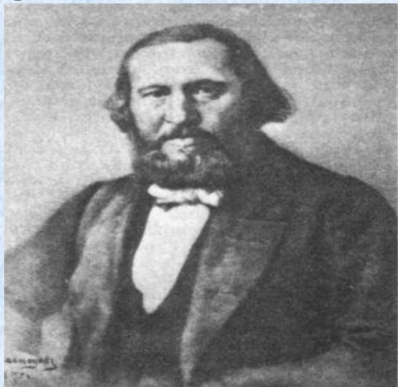
К. С. Аксаков