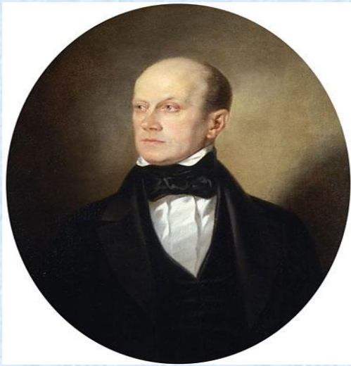
Т. Н. Грановский