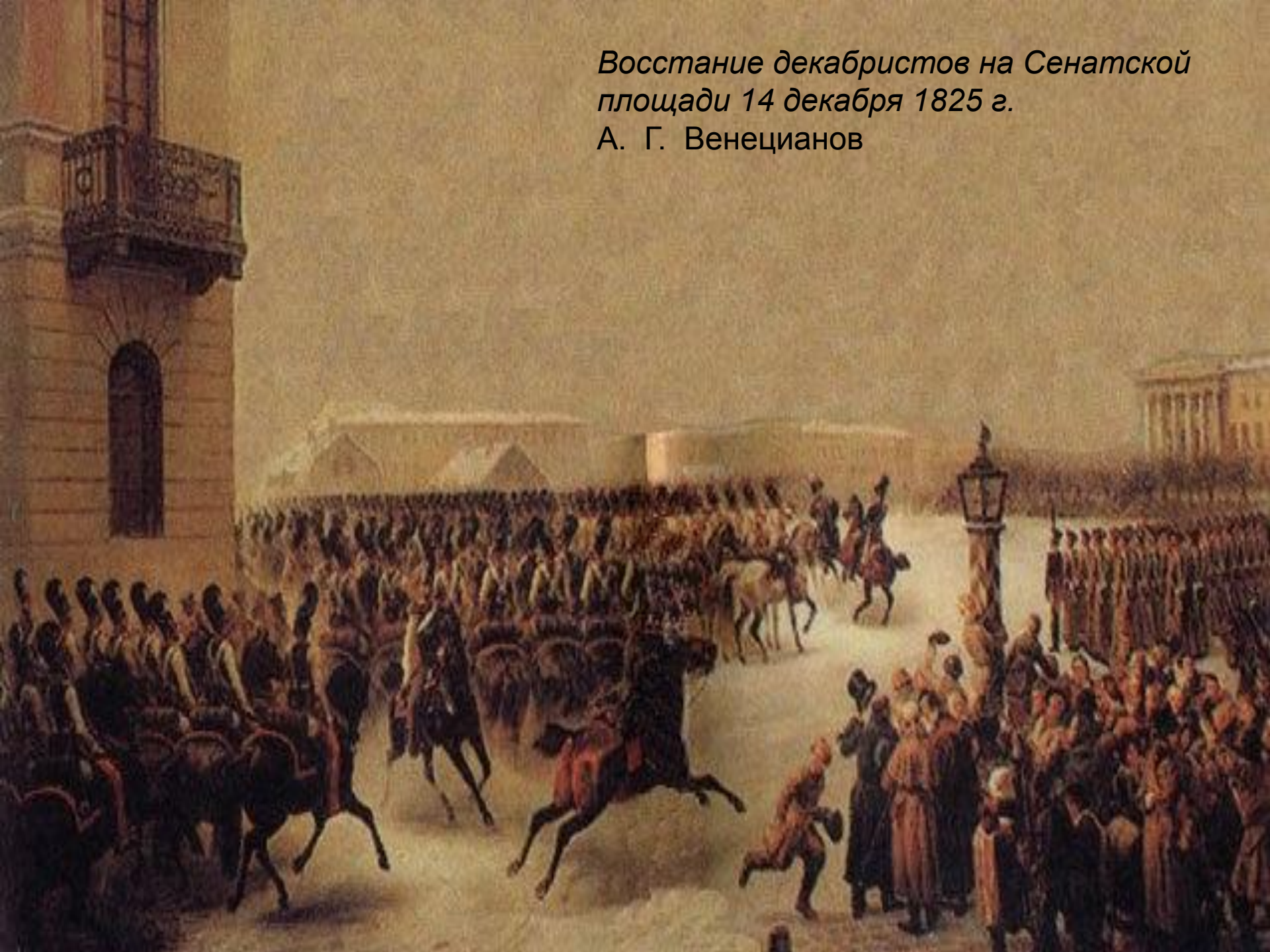
Восстание декабристов на Сенатской площади 14 декабря 1825 г. А. Г. Венецианов