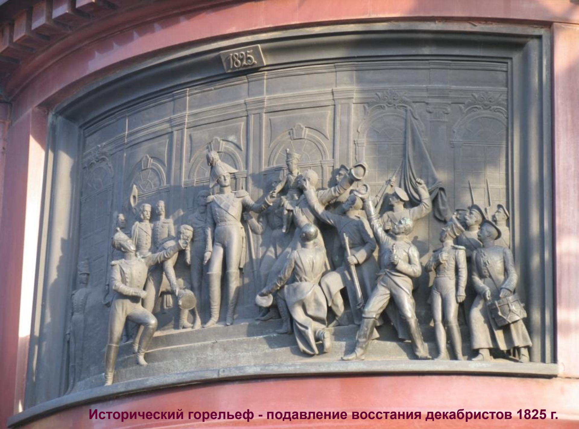
Исторический горельеф - подавление восстания декабристов 1825 г.