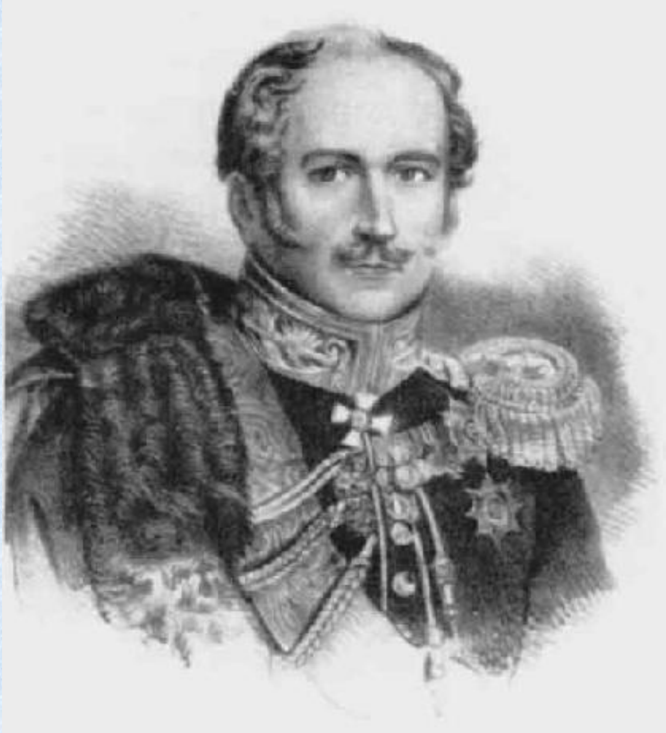
Александр Христофорович Бенкендорф