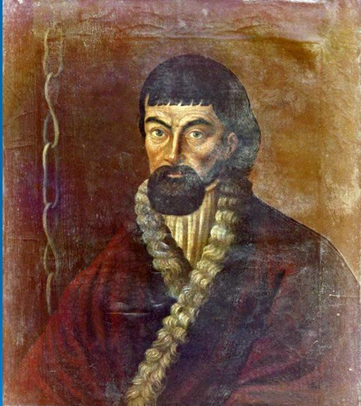
Е. И. Пугачёв