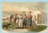
Татары, башкиры и др. переселенные народы России