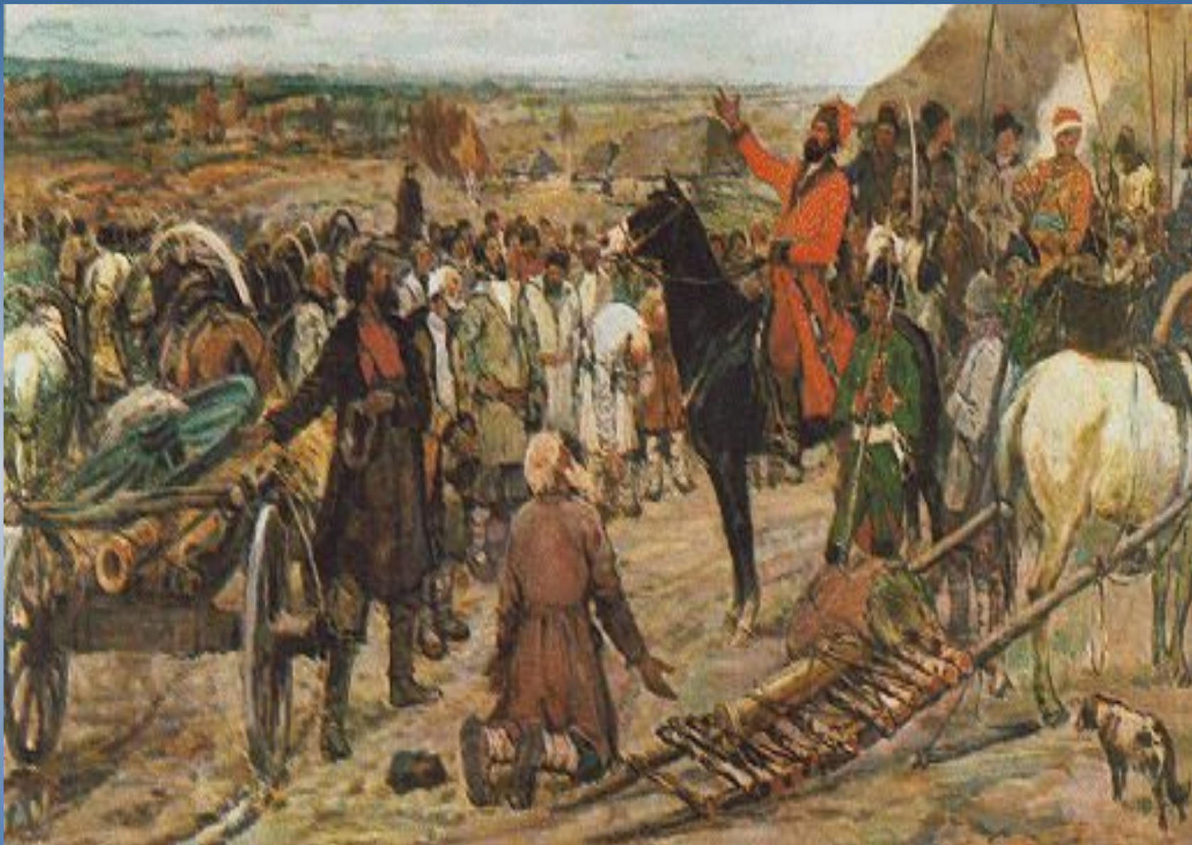
Рабочие уральских заводов привозят пушки Пугачеву