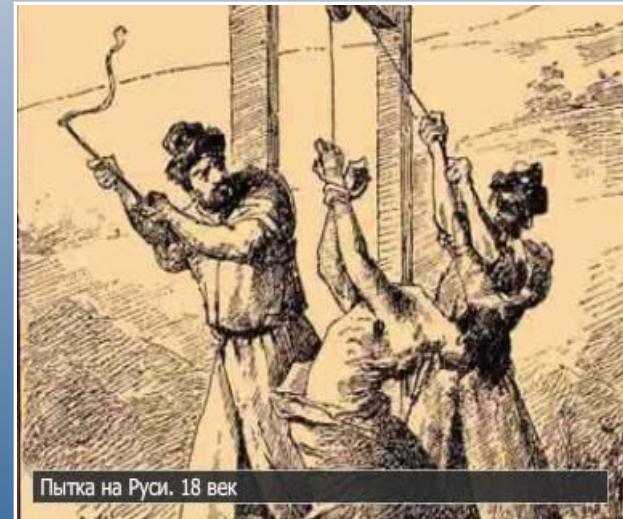
Пытка на Руси. 18 век