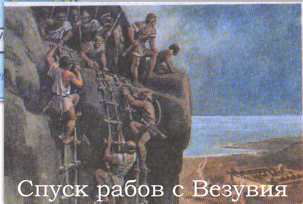
Спуск рабов с Везувия