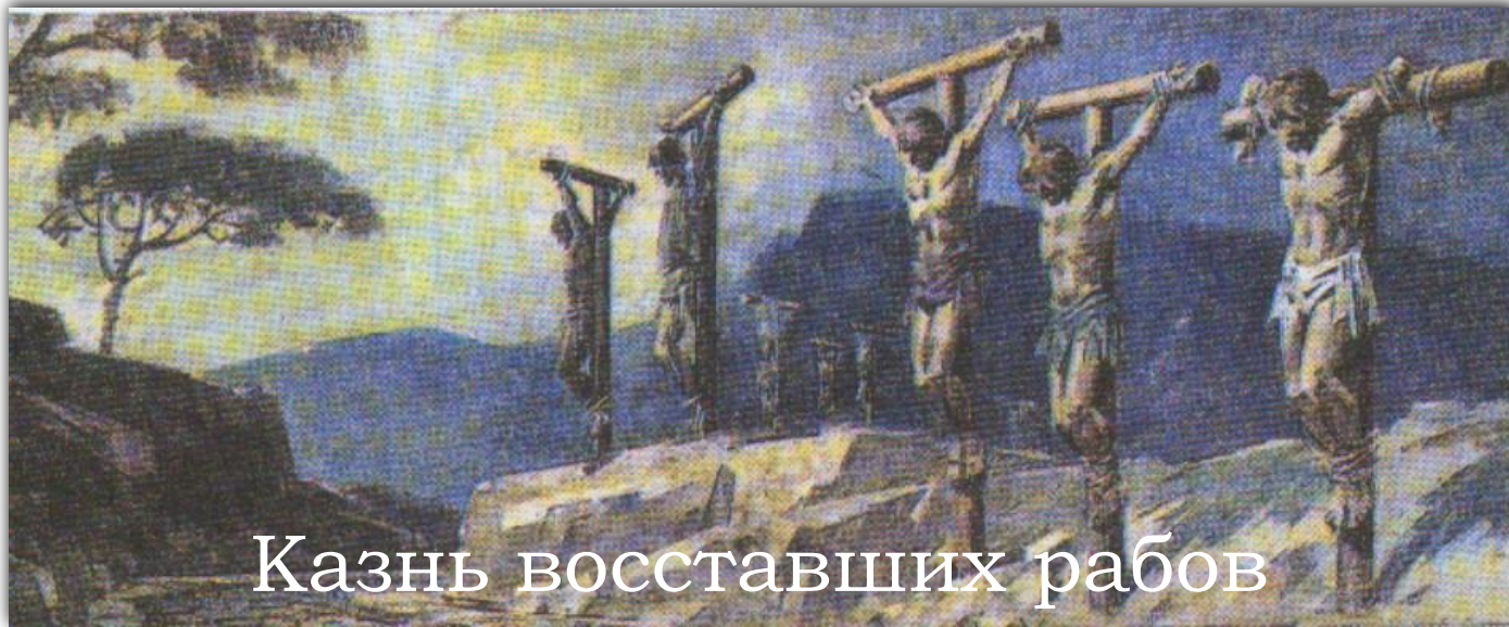
Казнь восставших рабов