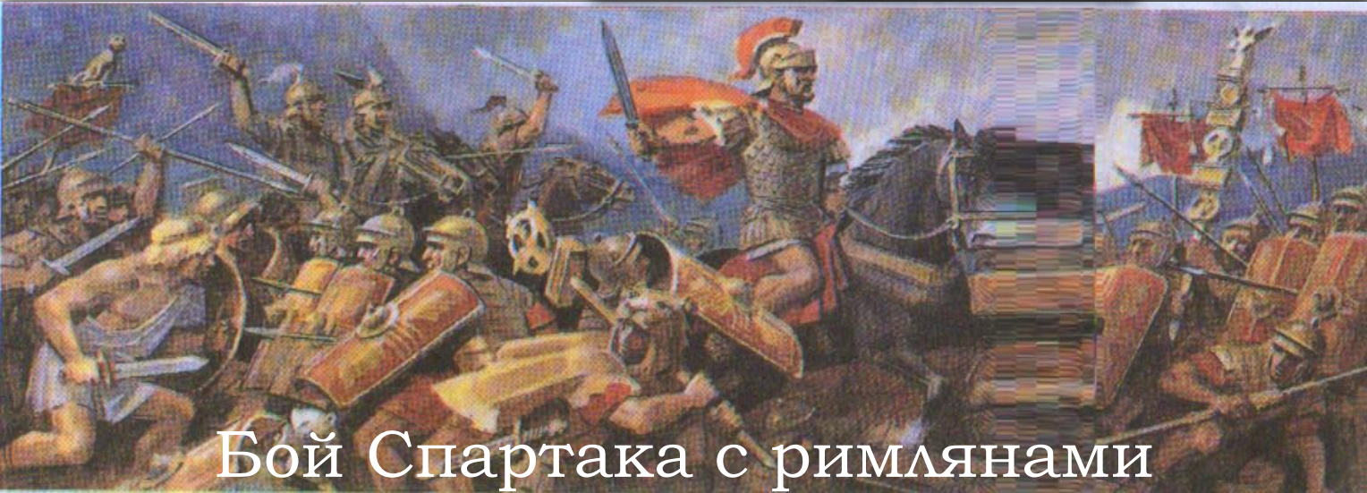
Бой Спартака с римлянами