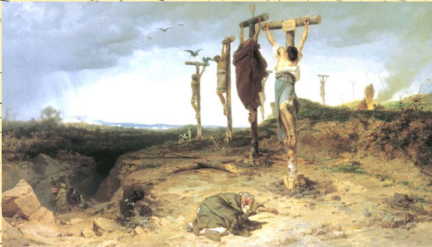
Ф.Бронников. Проклятое место. (1878 г.)