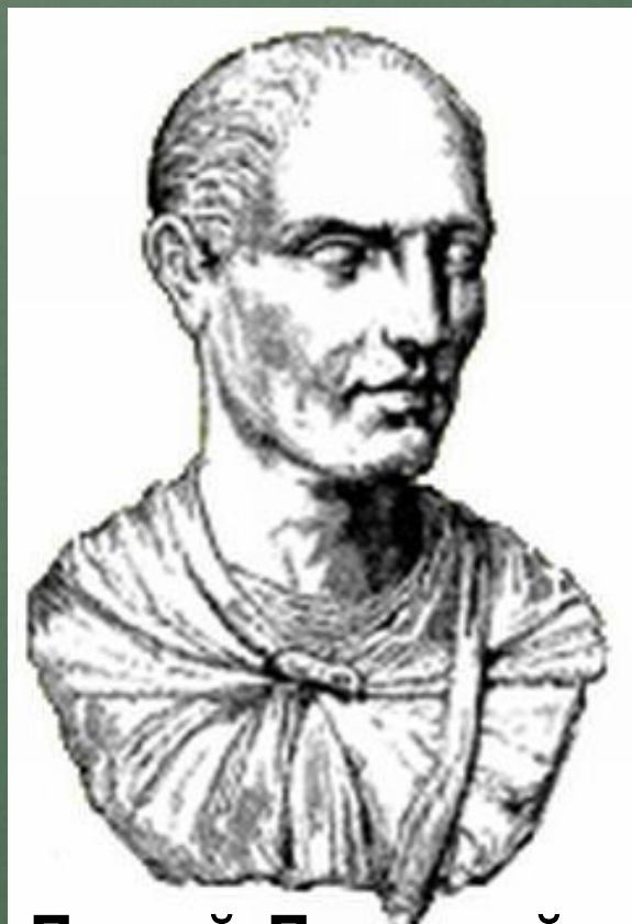
Луций Лициний Лукулл