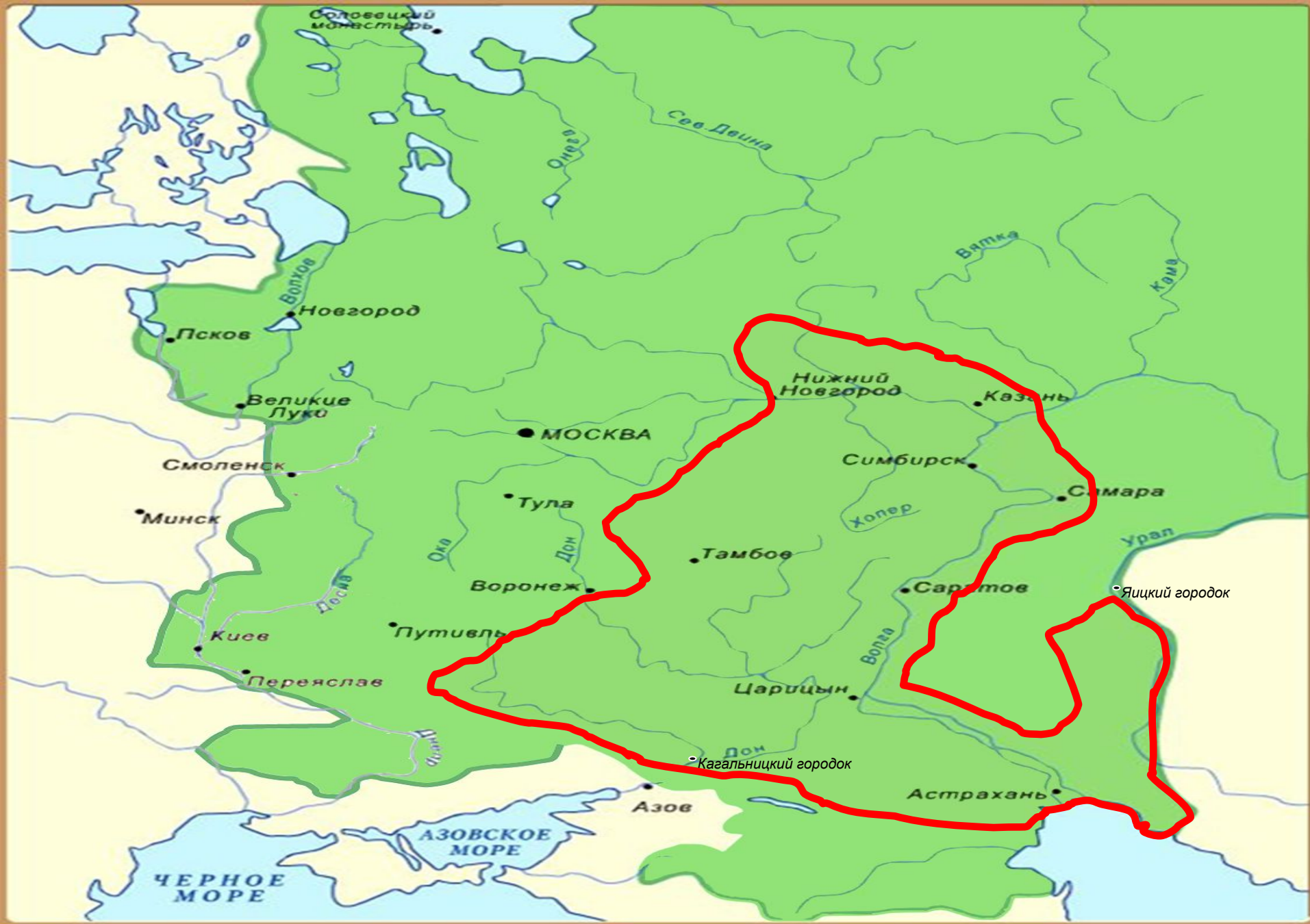
Карта «Восстание Степана Разина»