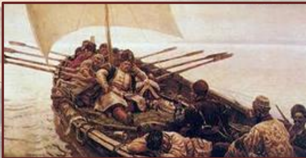
Василий Суриков. «Степан Разин»

К восстанию Степана Разина часто относят так называемый «Поход за зипунами» (1667—1669) — поход повстанцев «за добычей». Отряд Разина блокировал Волгу и тем самым перекрыл важнейшую хозяйственную артерию России. В этот период войска Разина захватывали русские и персидские купеческие корабли. Получив добычу и захватив Яицкий городок, летом 1669 года Разин двинулся к Кагальницкому городку, где стал собирать свои войска. Когда собралось достаточно людей, Разин заявил о походе на Москву.