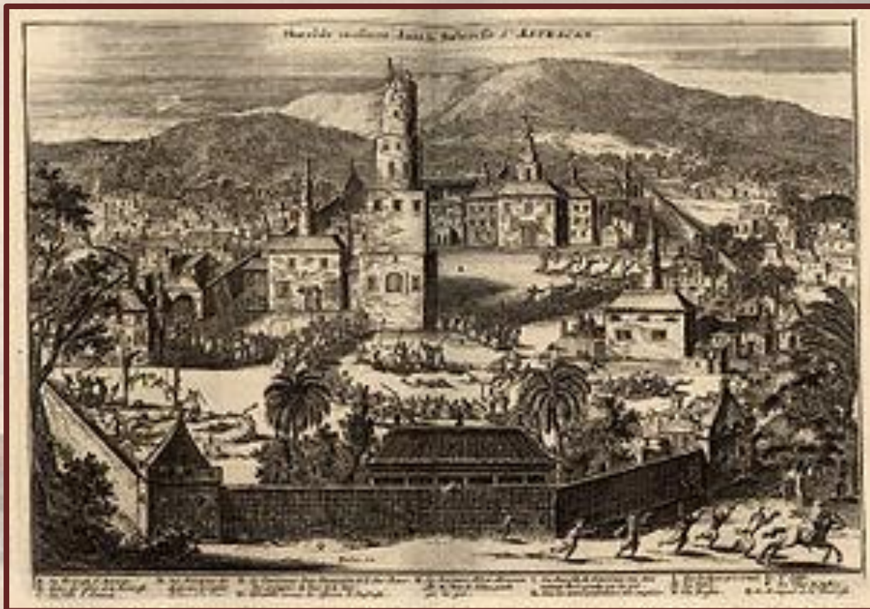
Взятие Астрахани разинцами. Гравюра XVII века