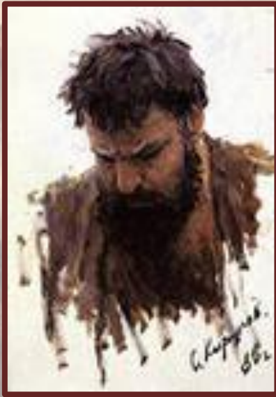
Этюд к картине «Степан Разин»

Разинцы не добились своей цели: уничтожения дворян и крепостного права. Но восстание Степана Разина показало, что русское общество было расколото.