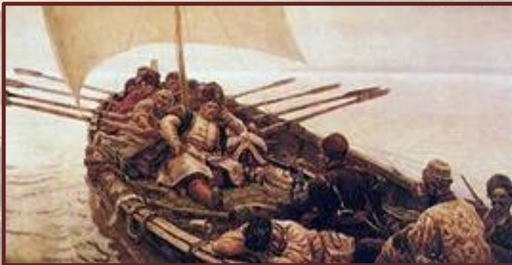
Василий Суриков. «Степан Разин»

К восстанию Степана Разина часто относят так называемый «Поход за зипунами» (1667—1669) — поход повстанцев «за добычей». Отряд Разина блокировал Волгу и тем самым перекрыл важнейшую хозяйственную артерию России. В этот период войска Разина захватывали русские и персидские купеческие корабли. Получив добычу и захватив Яицкий городок, летом 1669 года Разин двинулся к Кагальницкому городку, где стал собирать свои войска. Когда собралось достаточно людей, Разин заявил о походе на Москву.