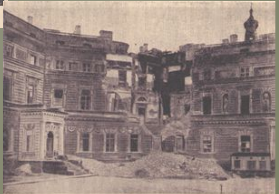
Нижневольтский банк, разрушенный 4 апреля 1942 г. футбольной бомбой