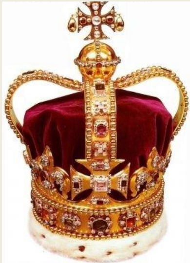
Корона Святого Вацлава (Корона чешских королей