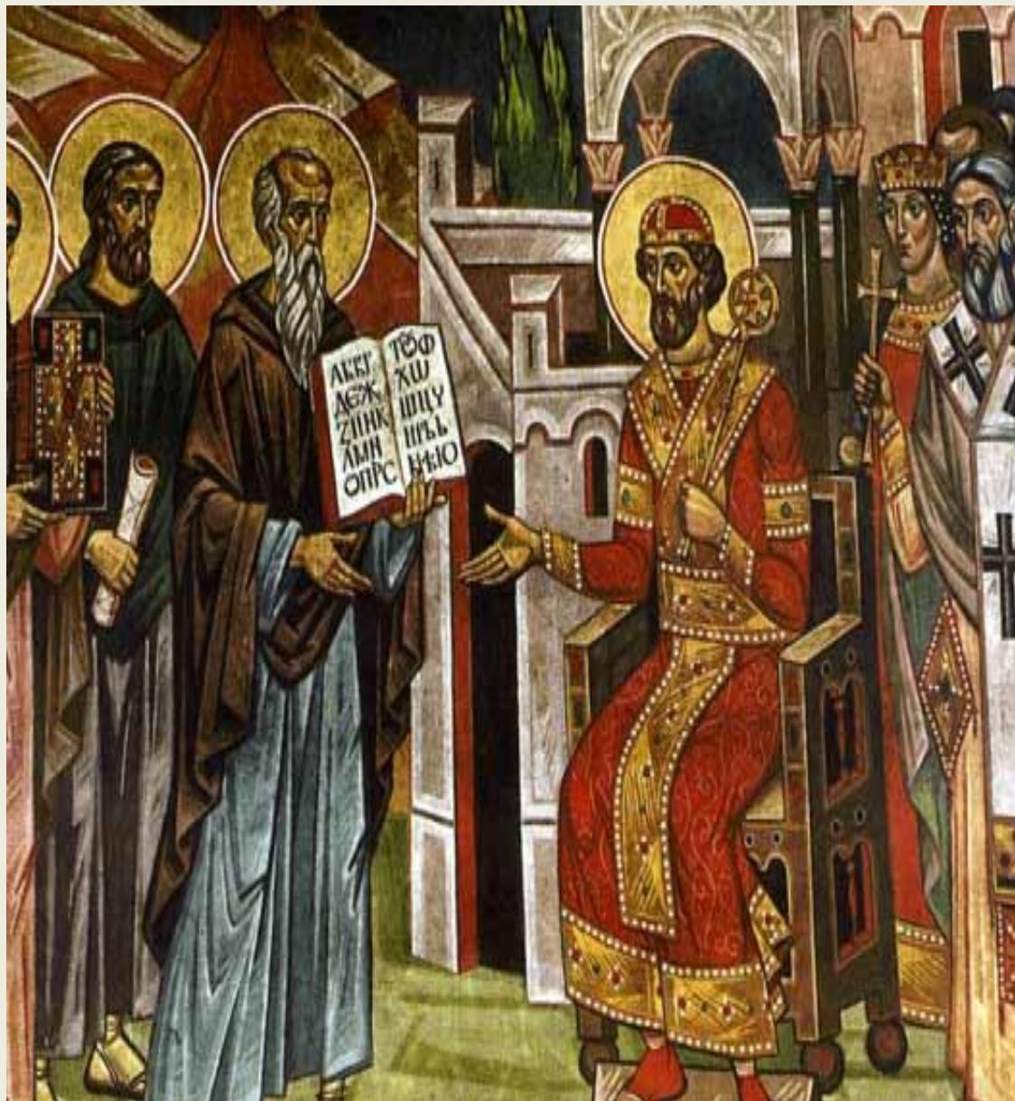
Болгарский царь Борис

К XI веку , ослабев от непрерывных войн, Болгария попадает под власть Византии.