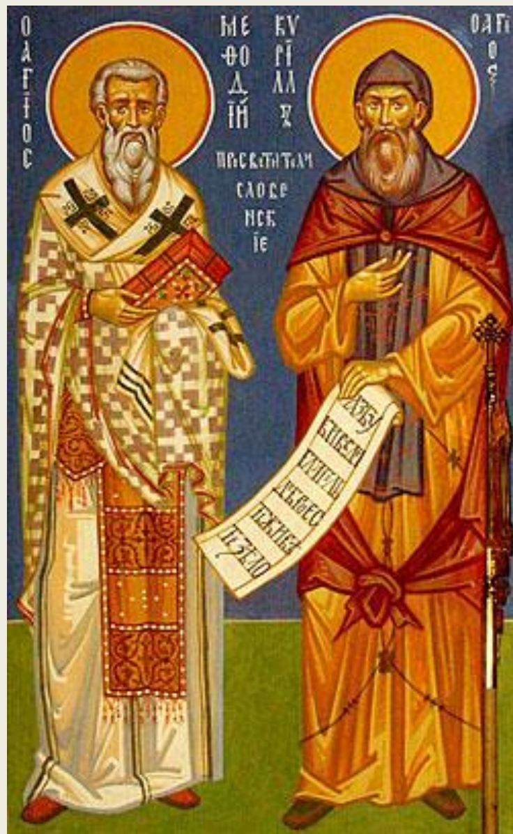
Святые равноапостольные братья Кирилл и Мефодий.