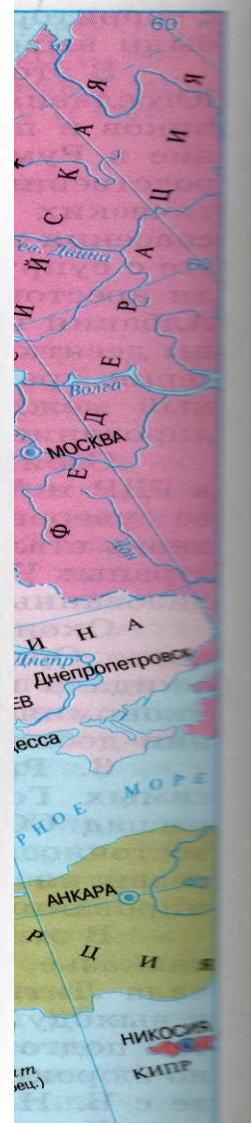
ания давия ·Марино ако эра