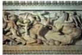
Александр Македонский в битве с персами. Рельеф. IV в. до н.э.