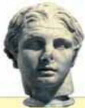
Александр Македонский. Скульптурный портрет. 150 г. до н.э.