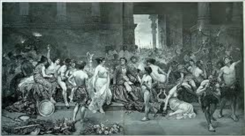
Александр Македонский пирует с гетерами в захваченном Персеполесе. Рисунок Г. Симона

Взяв Вавилон, который без боя сдал сатрап Вавилонии Мазей, Александр велел восстановить разрушенный персами храм главного божества Мардука, за что жрецы провозгласили его царем Вавилона. Персеполь, столицу Персидского царства, Александр объявил самым враждебным из азиатских городов и отдал на разграбление своим войнам. Источники единодушны в описании страшного разгрома, которому подвергся этот богатейший город.