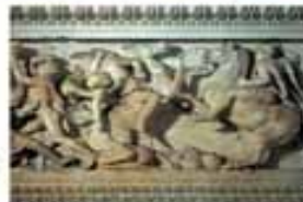
Александр Македонский в битве с персами. Рельеф. IV в. до н.э.