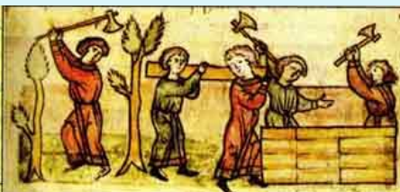
Построение Новгорода ильменскими словенеми