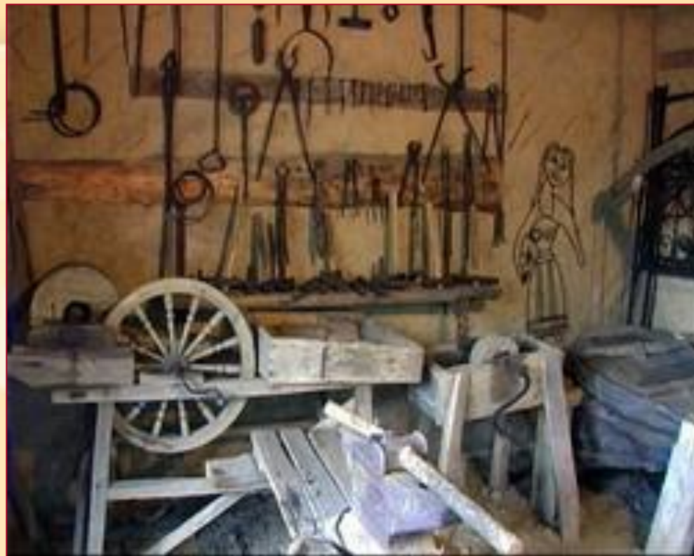
Орудия труда восточных славян

В случае военной опасности с врагами сражалось всё мужское население – народное ополчение.