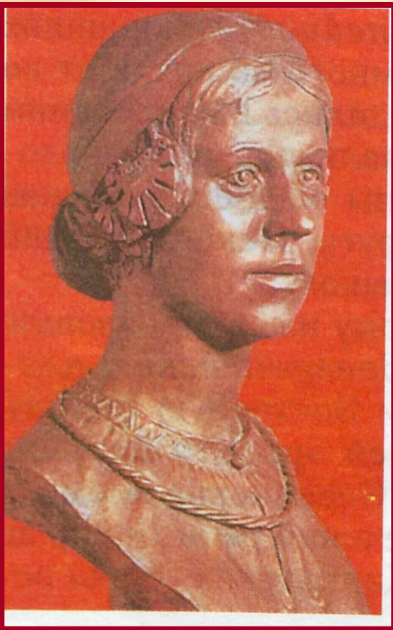
Женщина - славянка

Славяне отличались высоким ростом, могучим телосложением, обладали незаурядной физической силой и необыкновенной выносливостью. У них были русые волосы, румяное лицо и серые глаза. Славяне были добродушны и гостеприимны. Славяне почтительно относились к родителям.