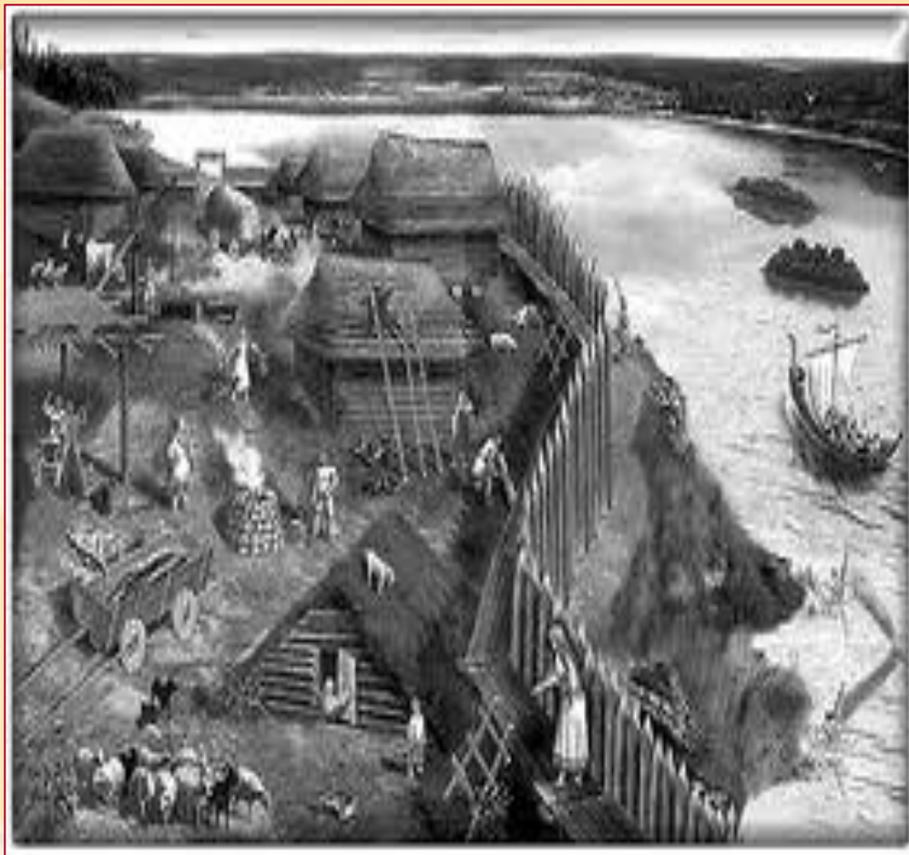
Поселок восточных славян