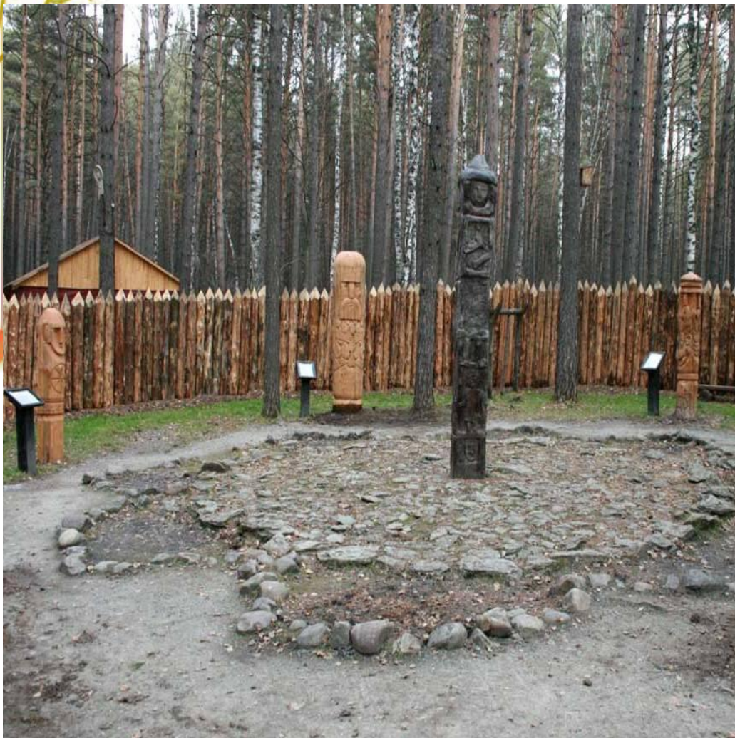
Капище и идола древних славян Историко-культурный и природный музей-заповедник Томская писаница