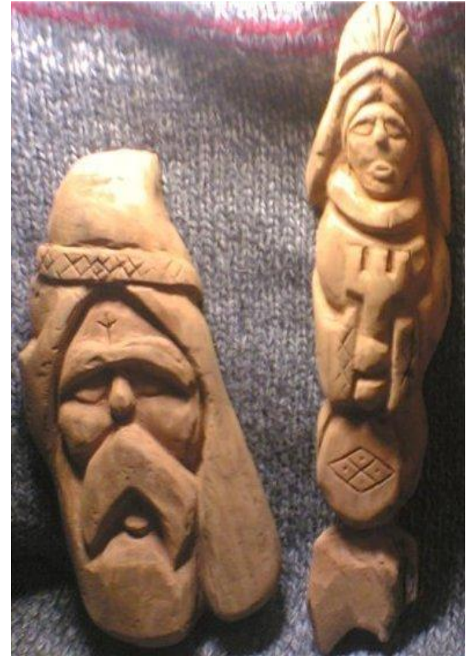
Славянские боги Сварог и Мокошь

Идол – деревянная или каменная статуя, изображение бога