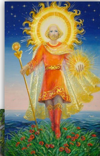
Ярило бог солнца