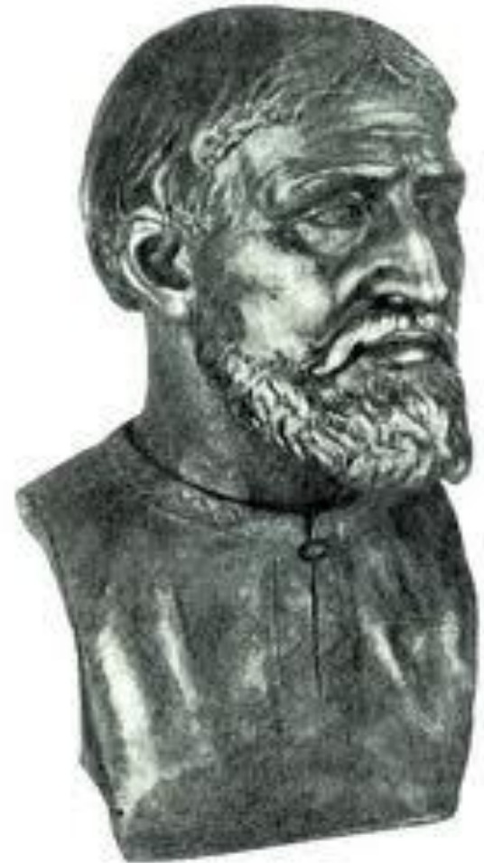
Мужчина из племени кривичей