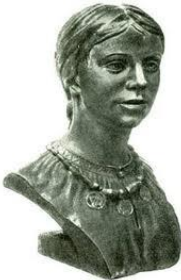
Женщина из племени вятичей