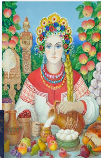
Мокошь божество плодородия