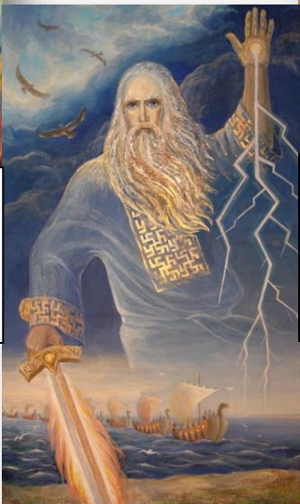
Перун бог грома и молний