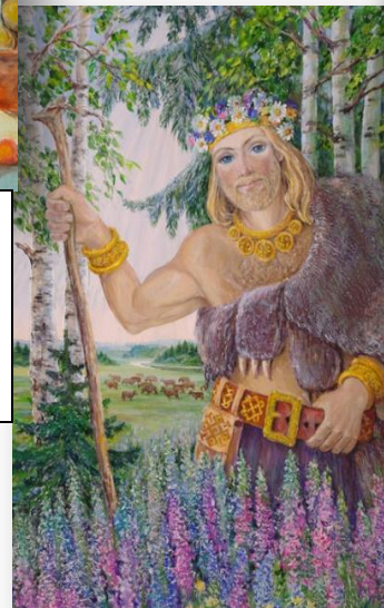
Велес покровитель скотоводства