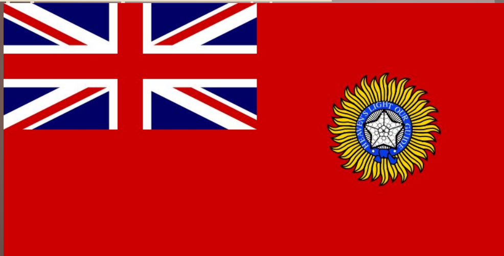
Флаг Британской Индии