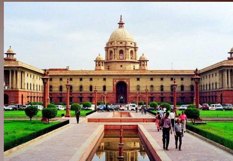
Дворец вице-короля в Дели