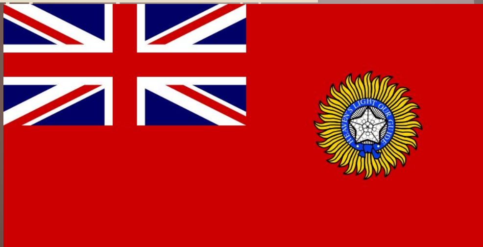
Флаг Британской Индии