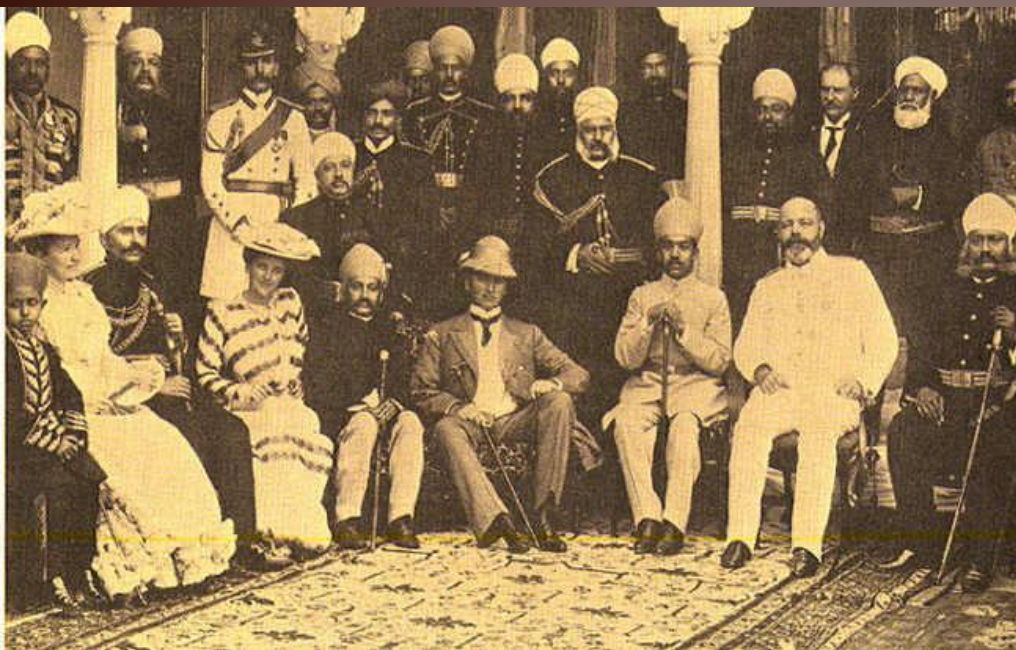
Вице-король Индии лорд Керзон в окружении индийской знати