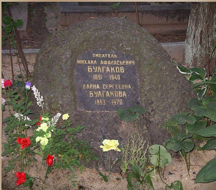
Камень с могилы Гоголя на могиле Булгакова