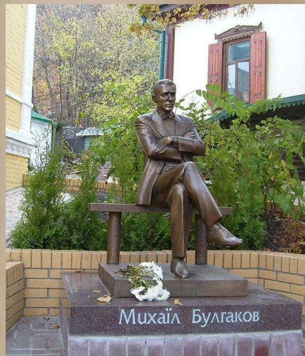
Открытый в октябре 2007 года памятник Булгакову возле его дома-музея в Киеве