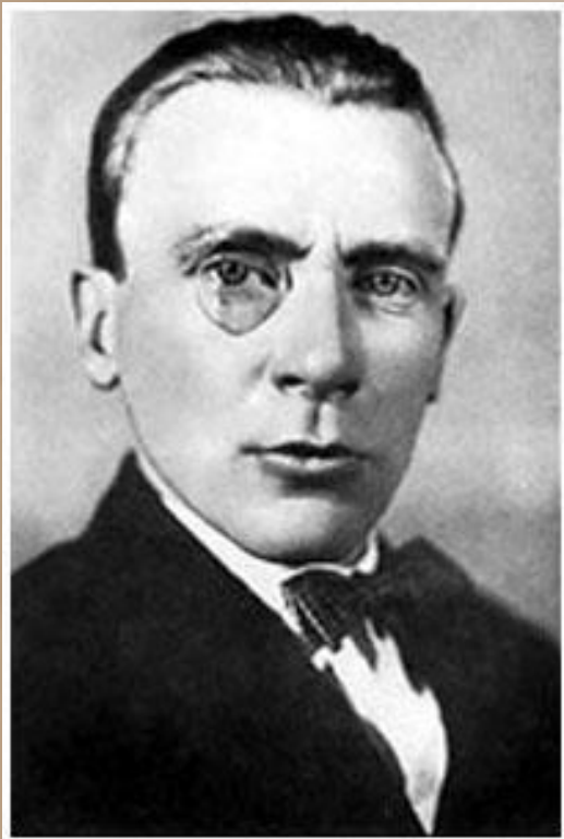
Михаил Булгаков. Фото 1926 г

В конце сентября 1921 года Булгаков переехал в Москву и начал сотрудничать как фельетонист со столичными газетами («Гудок», «Рабочий») и журналами («Медицинский работник», «Россия», «Возрождение»). В это же время он публикует отдельные произведения в газете «Накануне», выпускавшейся в Берлине. С 1922 по 1926 год в «Гудке» напечатано более 120 репортажей, очерков и фельетонов Булгакова.