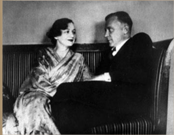
апрель 1935 года, Елена Сергеевна, М. А.Булгаков