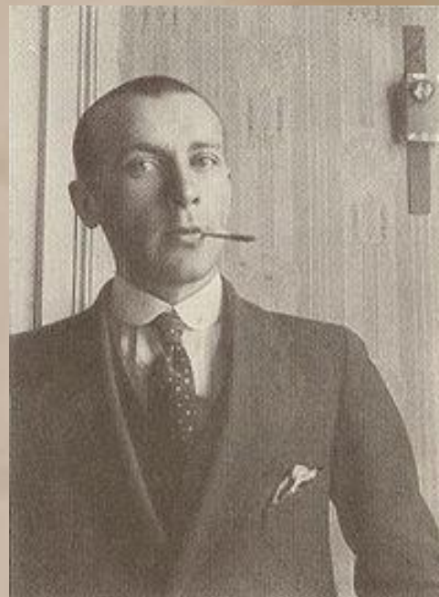
Булгаков в 1910-х годах во время учёбы в Киевском университете.

Был направлен на работу в село Никольское Смоленской губернии, затем работал врачом в Вязьме. В 1913 году Булгаков вступает в свой первый брак — с Татьяной Лаппа .