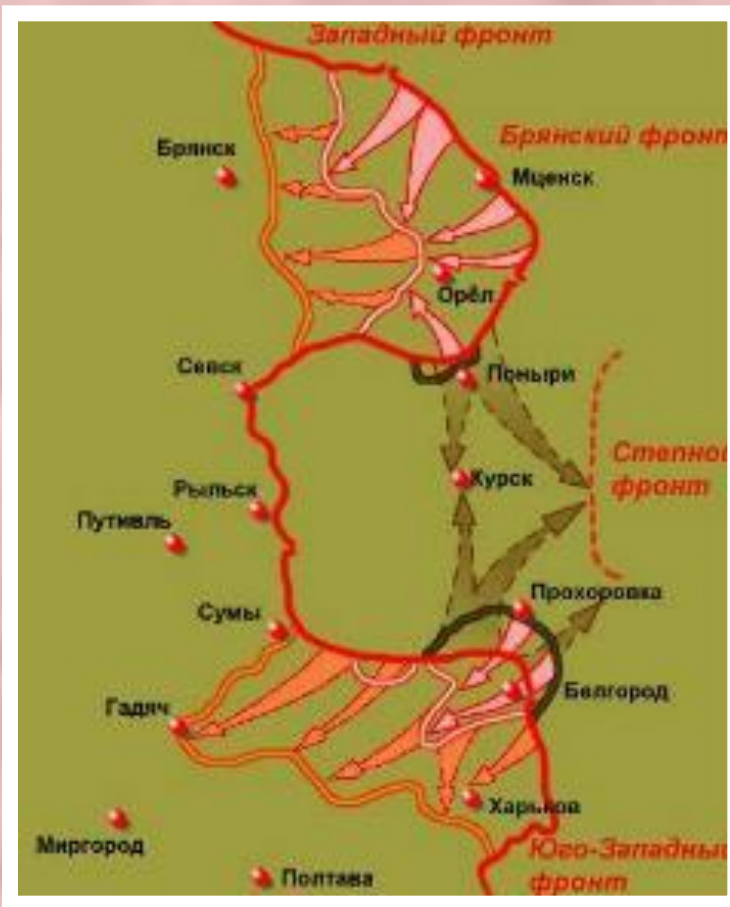
Битва на Курской Дуге.

Эти поражения обескровили немецкую армию, но Гитлер жаждал реванша. Он провел мобилизацию и направил на фронт 2 млн солдат. На вооружение немцев были поставлены танки «Тигр» и «Пантера», штурмовые орудия «Фердинанд». Немецкое руководство намеревалось «срезать» Курскую дугу и взять реванш за Сталинград. По предложению Жукова Красная Армия перешла к преднамеренной обороне. К этому времени она получила новые танки Т-34.