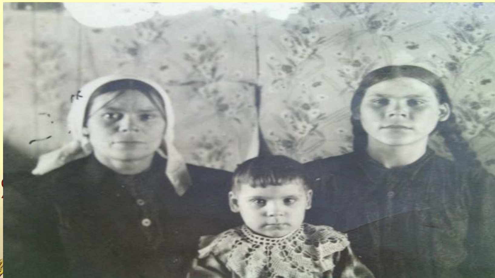
Моя прабабушка (справа) с младшей сестрой и мамой