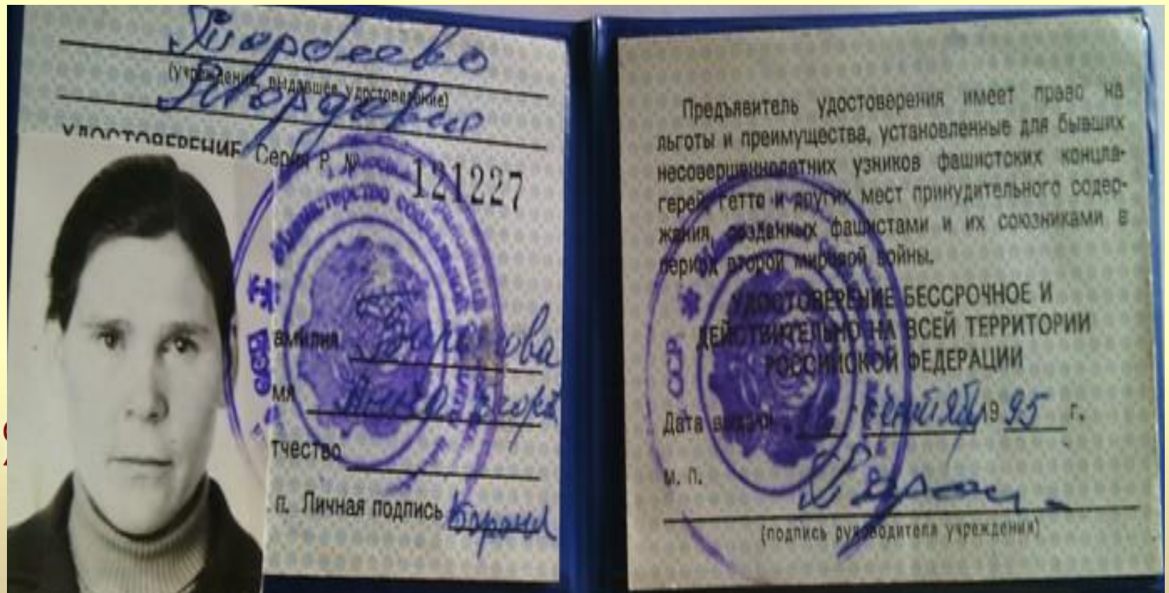
Удостоверение малолетнего узника фашистских концлагерей