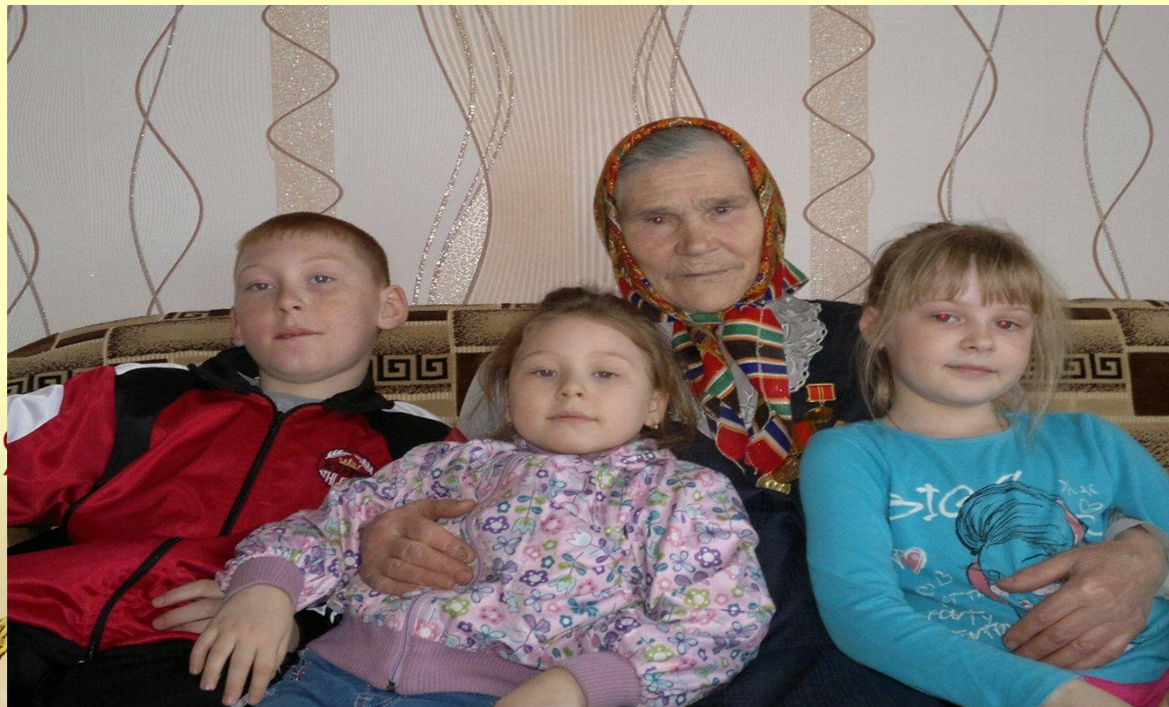
Прабабушка с правнуками