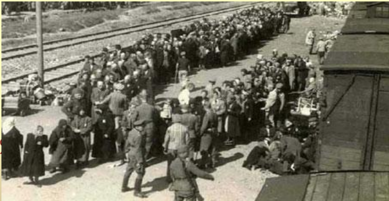
Погрузка пленных в вагоны