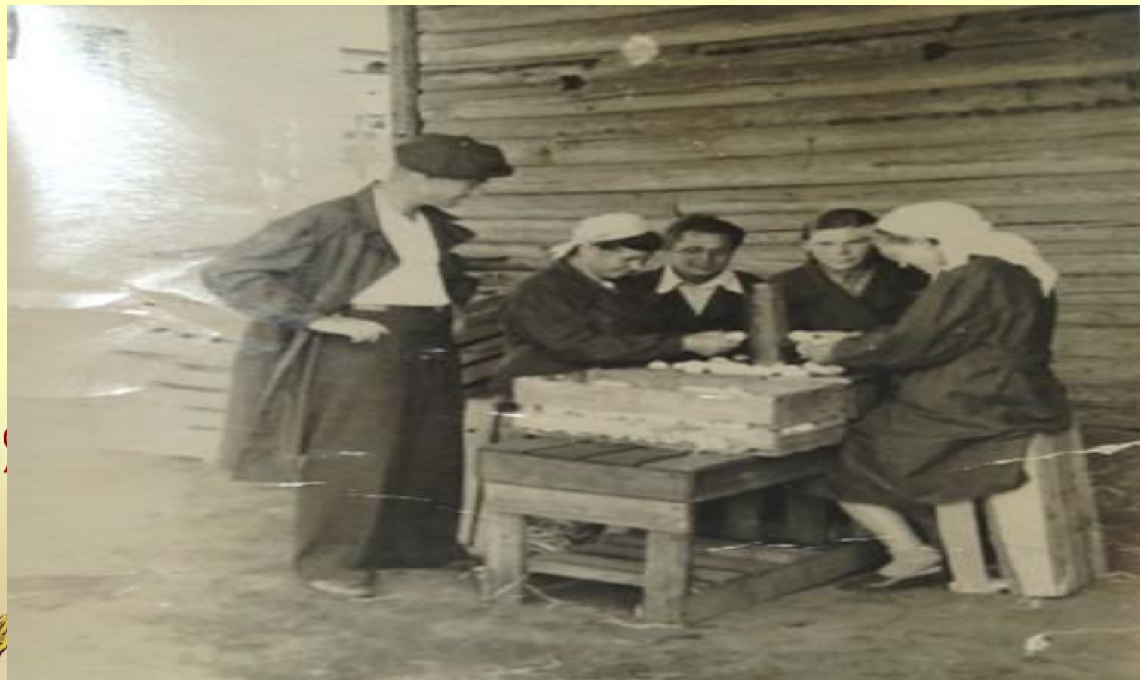
Сортировка яиц (прабабушка вторая справа)