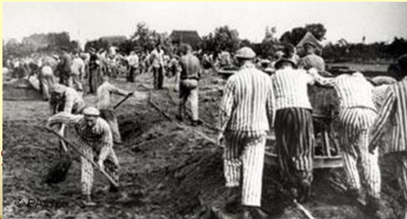
Работа взрослых под конвоем