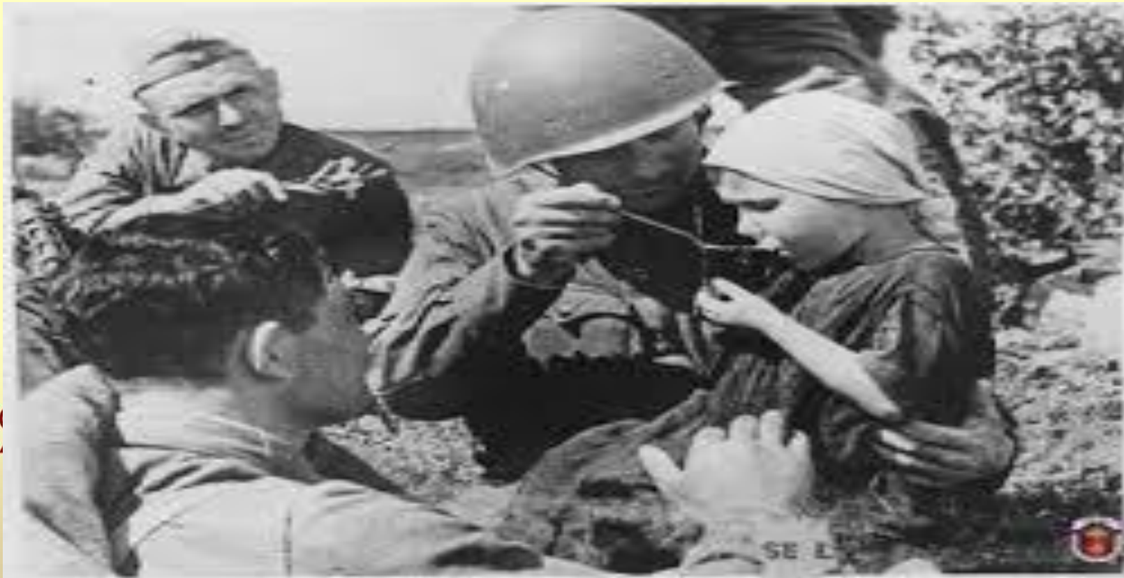
Русский солдат кормит ребенка