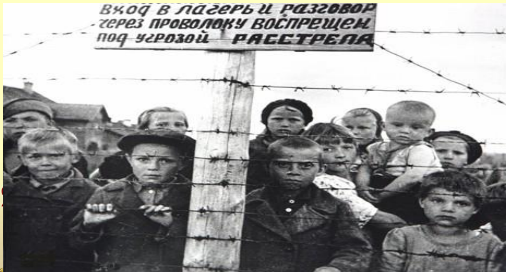
Малолетние узники концлагеря