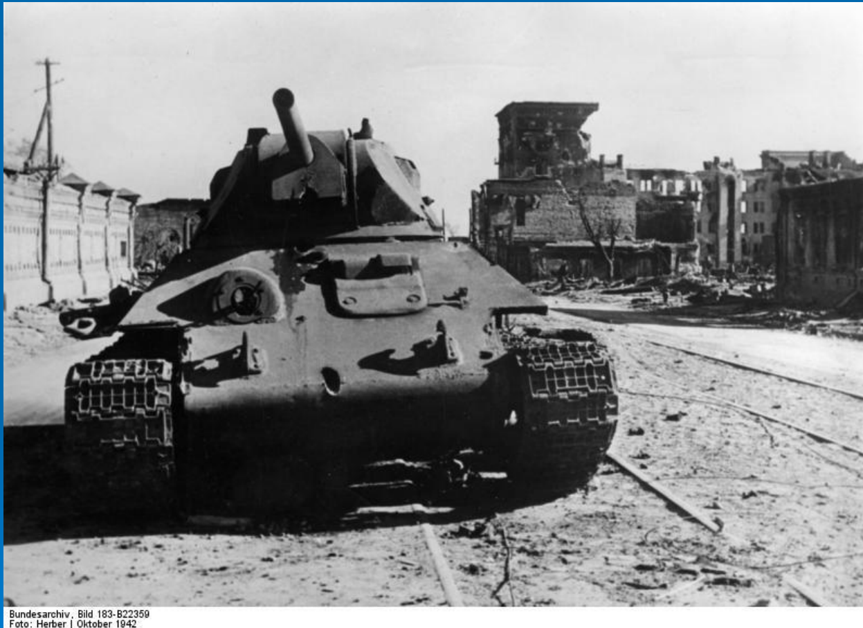
Bild 183-B22359 Oktober 1942