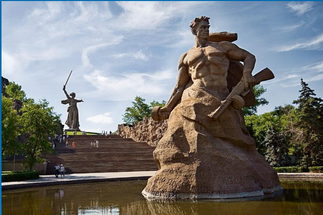
На фото: Мамаев Курган

Мамаев курган расположен в Центральном районе города Волгограда, где во время Сталинградской битвы происходили ожесточённые бои (особенно в сентябре 1942 года и январе 1943) продолжительностью 200 дней.