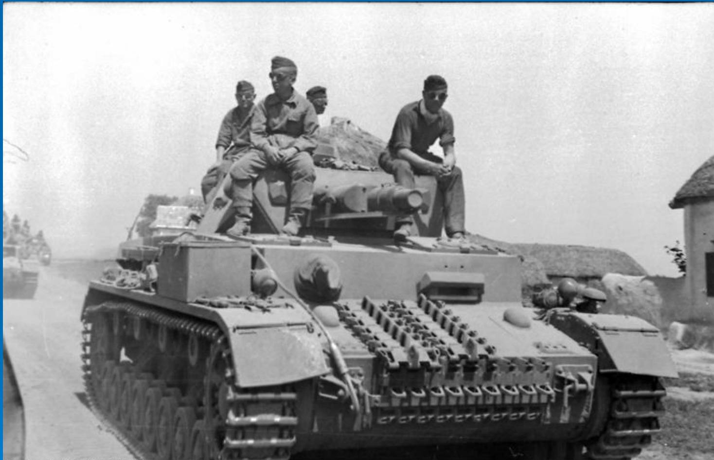
Juni 1942