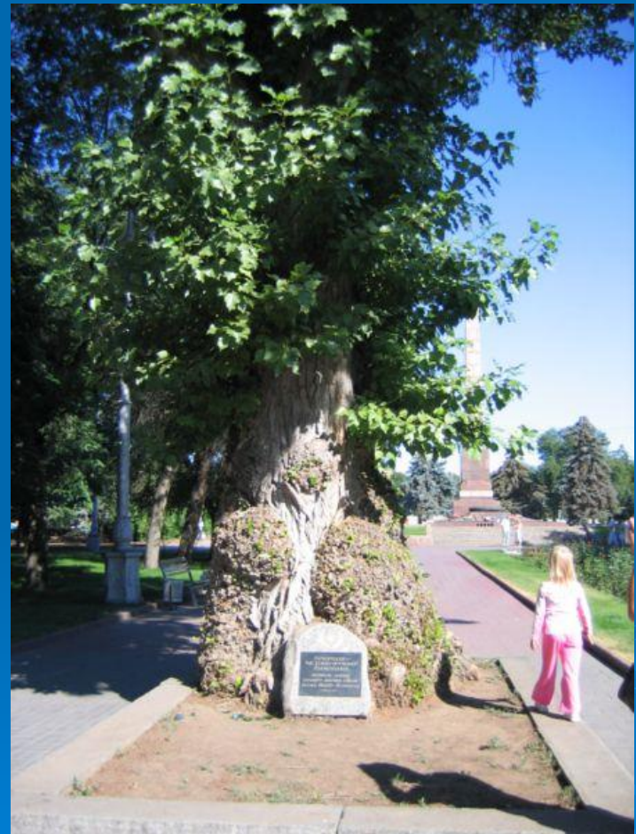
На фото: Тополь на Аллее Героев

Тополь на Аллее Героев — исторический и природный памятник Волгограда. Расположен в Центральном районе на Аллее Героев рядом с «Вечным огнём» и памятником Рубену Ибаррури. Тополь, выживший в центре Сталинградской битвы — живой свидетель истории. Имеет на своем стволе многочисленные свидетельства военных действий.