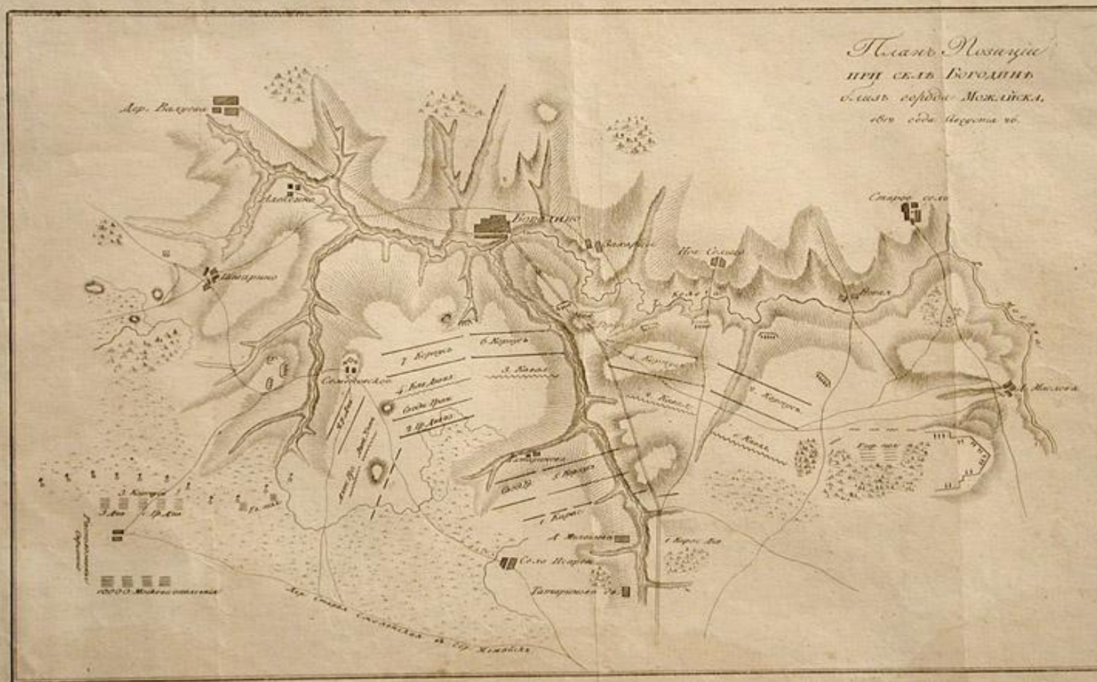
План Бородинского сражения разработанный М.И. Кутузовым.