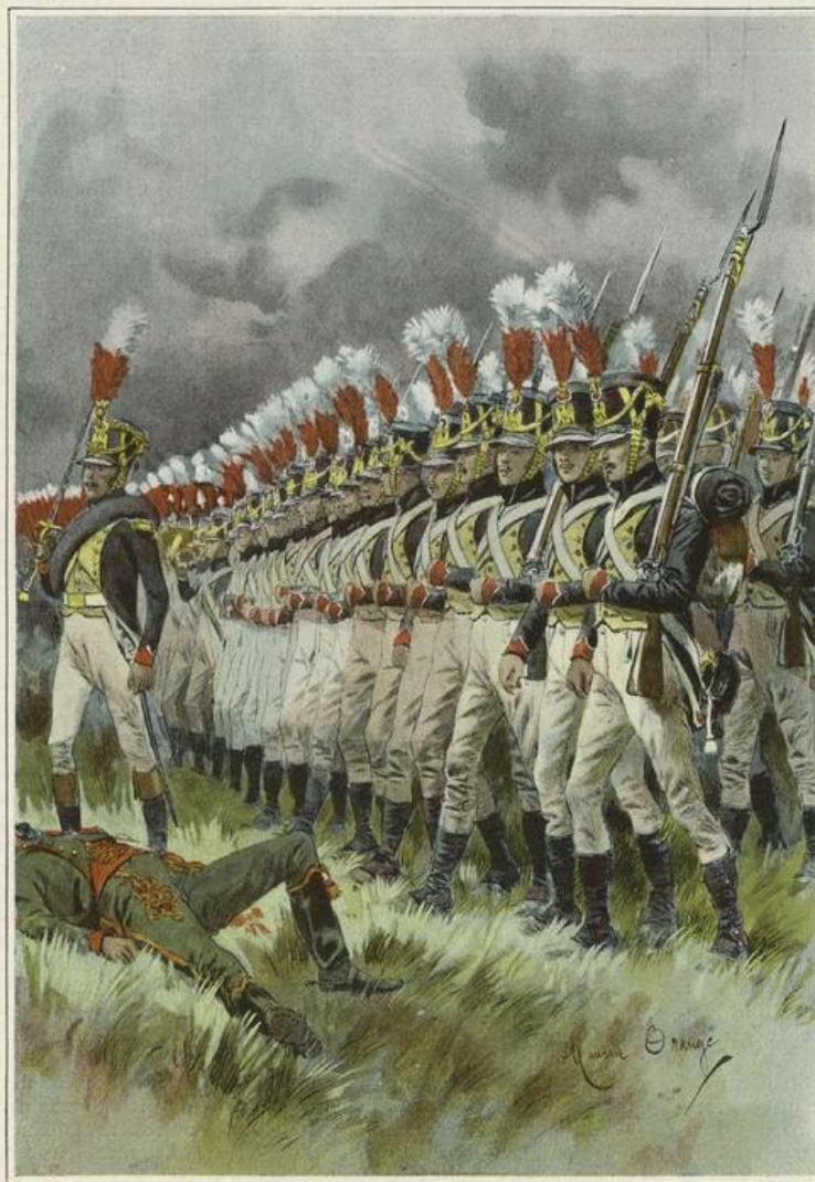
NOUS MARCHAMES L'ARME AU BRAS (page 4, numéro de janvier). FIG. Féb 1896 Russian Company

И так, русская сторона до самого дня наполеоновского вторжения не имела, а главное, долго не могла определить направления основного удара Наполеона (отсюда - разброс армий для одновременного прикрытия трех направлений) и вообще ставила свои действия в зависимость от действий противника. Нерешительность царя, переизбыток его советников и разнобой в их линиях, отсутствие полномочного главнокомандующего затрудняли подготовку к войне и усугубляли опасность надвигающейся на Россию грозы.