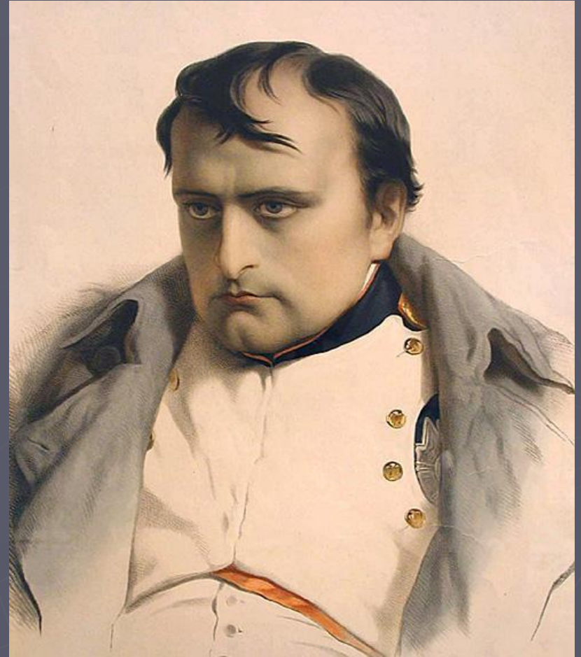
Император Франции Наполеон Бонапарт.

Невзирая на доступные Александром I и Наполеоном в Тильзите договоренности Россия и Франция остались противниками.