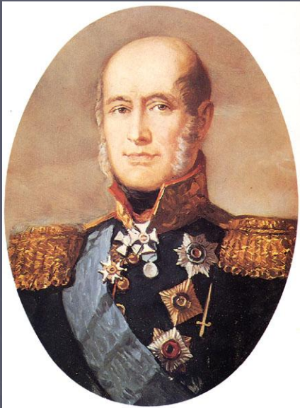
М.Б. Барклай де Толли.

Генералы командующие тремя главными группами, армиями, расположенными на Российской границе.