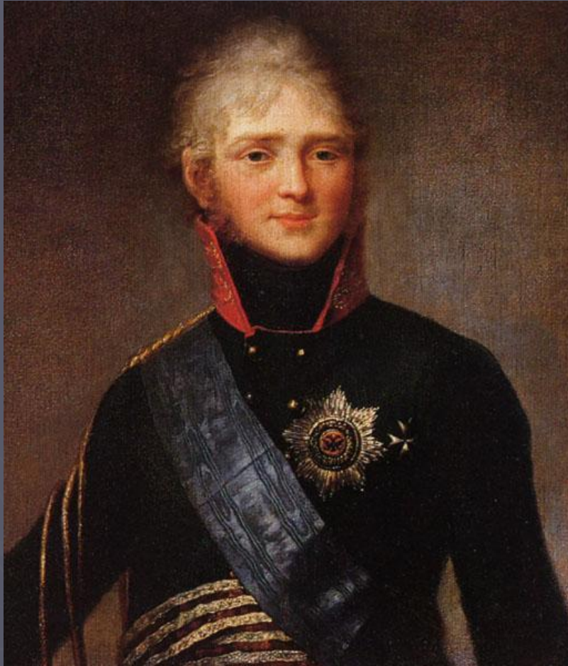
Император России Александр I.