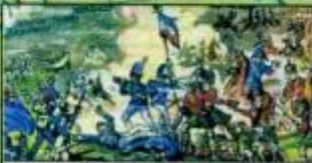
Битва при Ватерлоо 18 июня 1815 г.