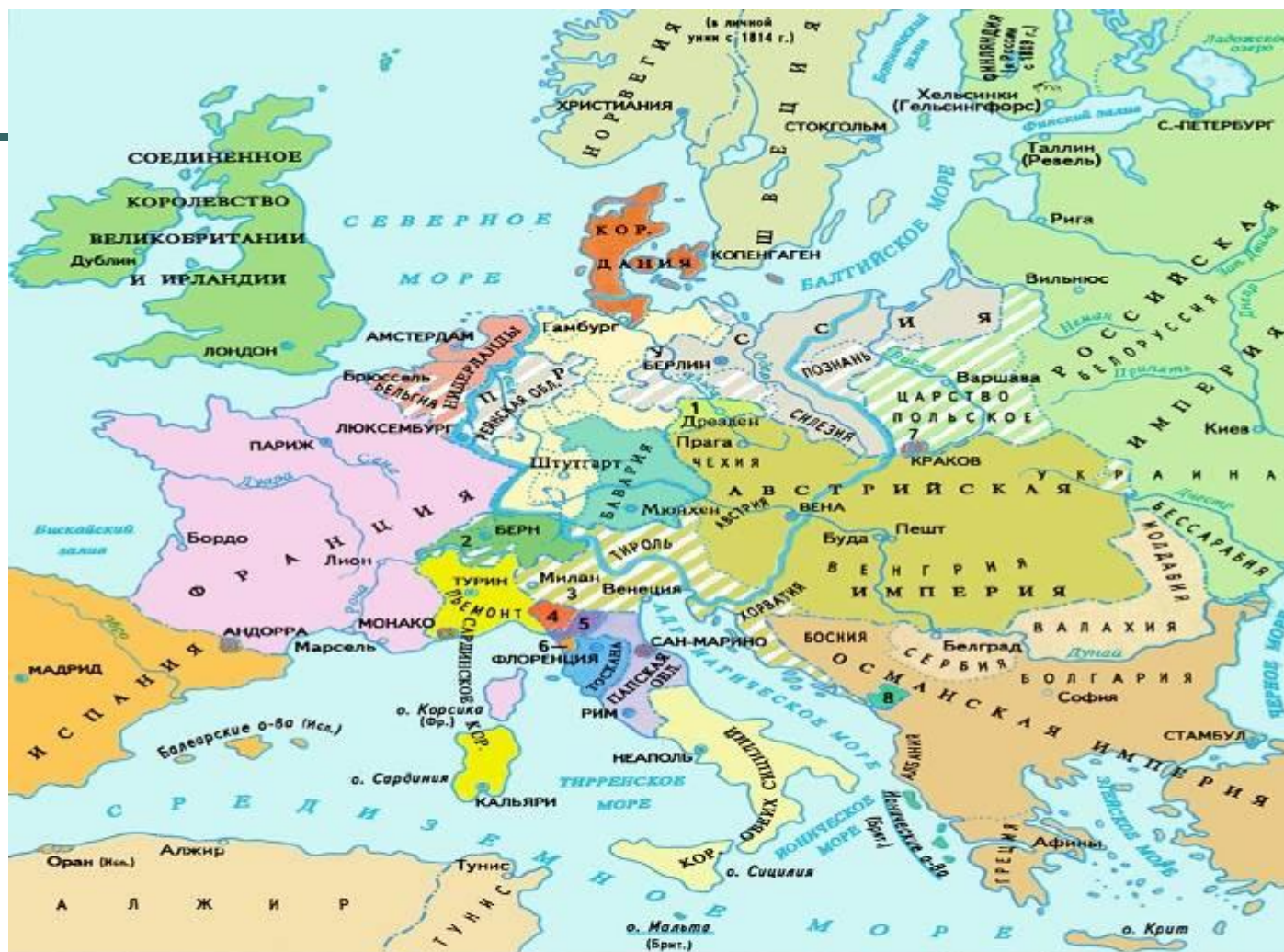
Территории, присоединенные по решению Венского конгресса