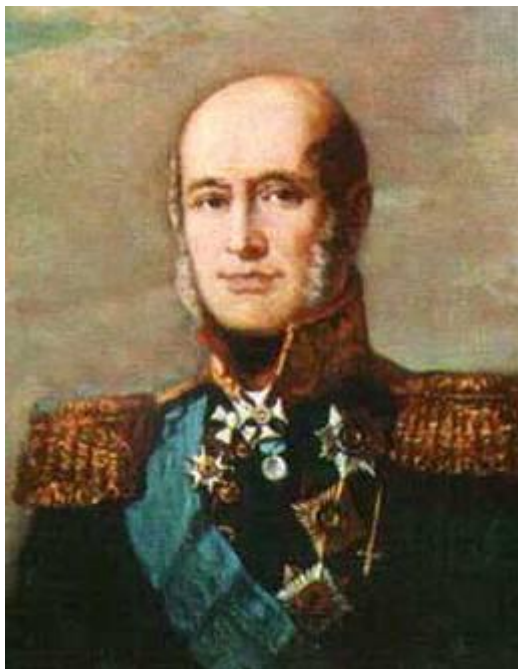
Барклай де Толли