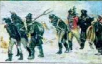
Русские партизаны ведут пленных французов.