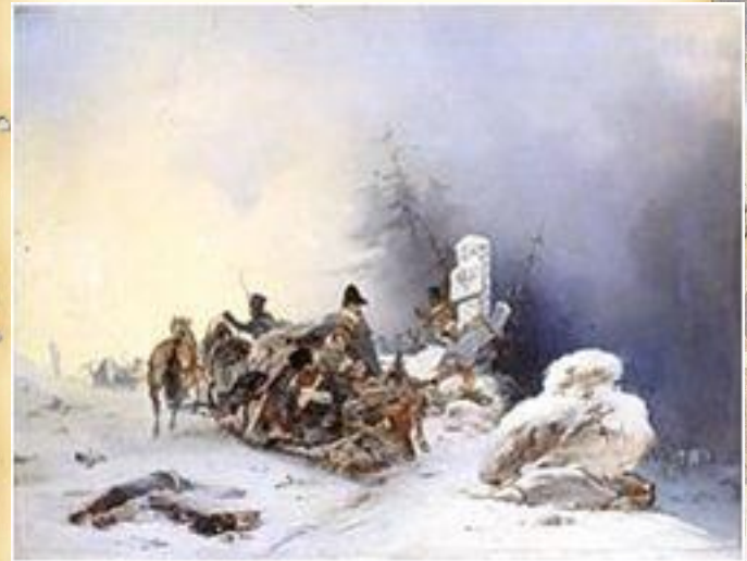
Бегство французов из России. Виллевальде (1846)