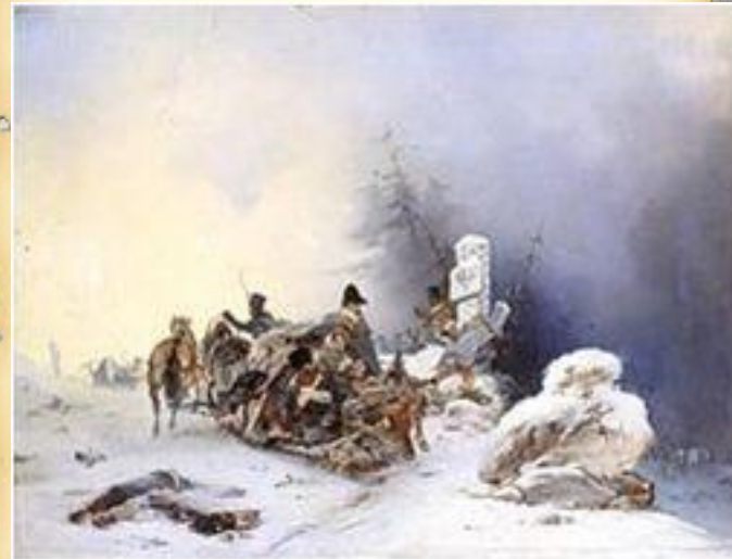
Бегство французов из России. Виллевальде (1846)