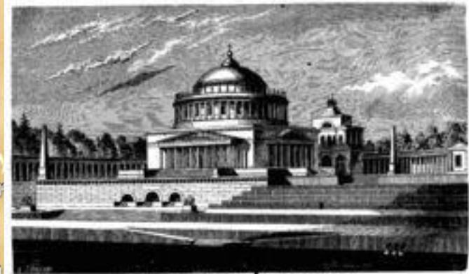
ХРАМЪ ХРИСТА СПАСИТЕЛЯ ВЪ МОСКВѢ, ПРОЕКТЪ АКАДЕМИКА ВИКТОРА.