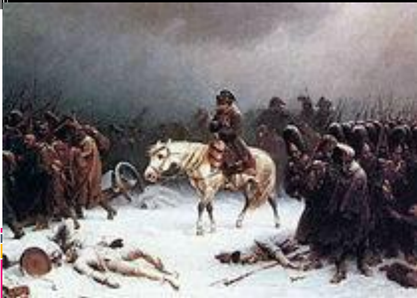
Отступление французской армии