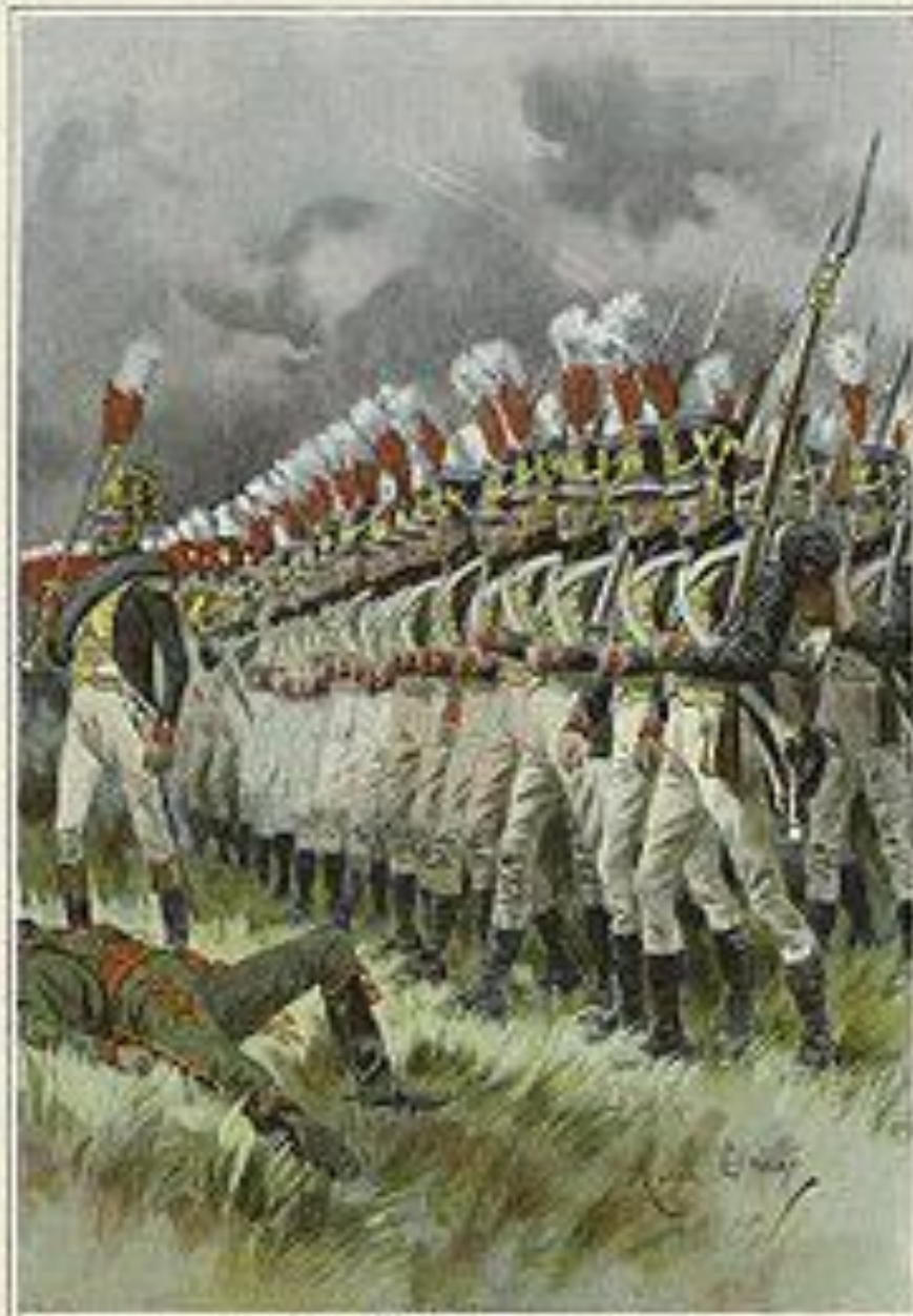
Illustration of a battle scene from the Napoleonic era, showing soldiers in uniform and a fallen soldier in the foreground.