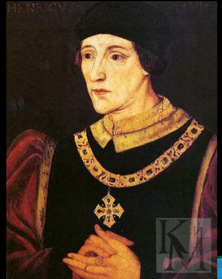
Генрих VI - третий и последний король Англии из династии Ланкастеров