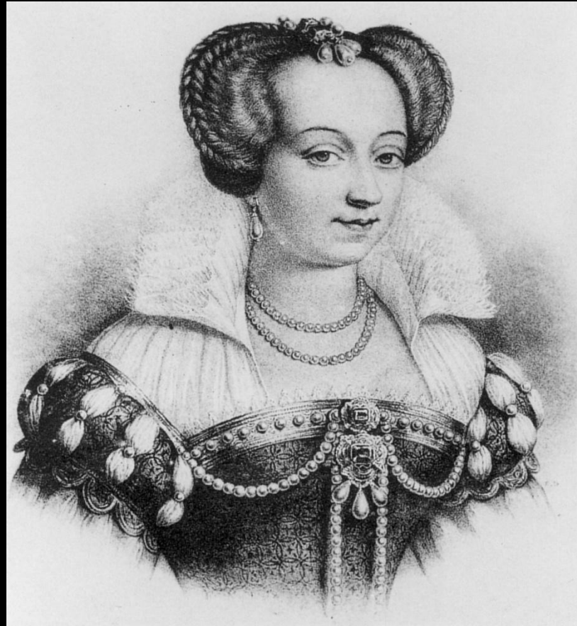
Маргарита Французская (Валуа)

Причиной войны стали недовольство значительной части английского общества неудачами в Столетней войне и политикой, проводимой женой короля Генриха VI королевой Маргаритой и его фаворитами