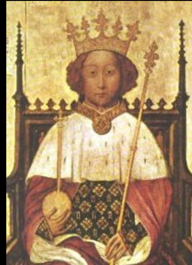
Ричард II английский король (1377-1399), представитель династии Плантагенетов, внук короля Эдуарда III

Основанием для этой претензии служило то, что Генрих VI был правнуком Джона Гонта четвертого сына короля Эдуарда III, а Йорк правнуком Лайонела третьего сына этого короля (по женской линии, по мужской линии он был внуком Эдмунда пятого сына Эдуарда III), к тому же, тот факт, что дед Генриха Шестого, Генрих Четвертый Ланкастер силой принудил короля Ричарда Второго отречься от престола, захватив власть в 1399, ставило под сомнение легитимность, вообще, всей королевской династии Ланкастеров.